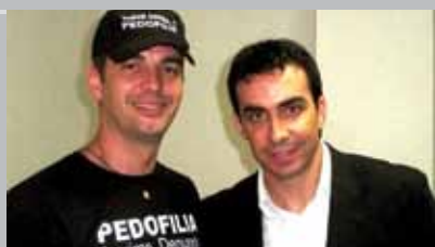
Padre Fábio de Melo