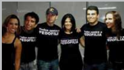
Tempero do Mundo