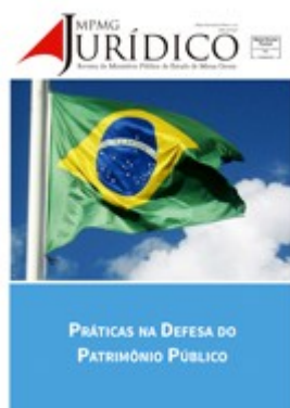
Práticas na defesa do Patrimônio Público