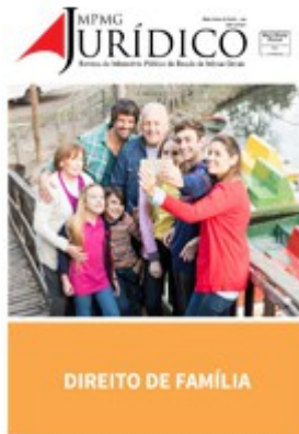
Direito de família

http://www.mpmg.mp.br/conheca-o-mpmg/escola-institucional/publicacoes-tecnicas/revista-mpmg-juridico/revista-mpmg-juridico.htm