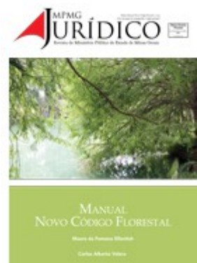
Manual Novo Código Floresta