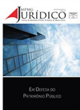
Em defesa do Patrimônio Público