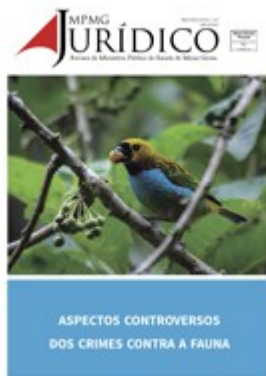
Aspectos controversos dos crimes contra a fauna