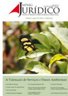
A Valoração de serviços e danos ambientais