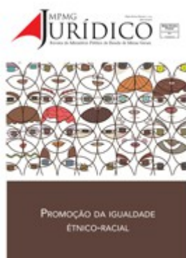
Promoção da Igualdade Étnico-racial