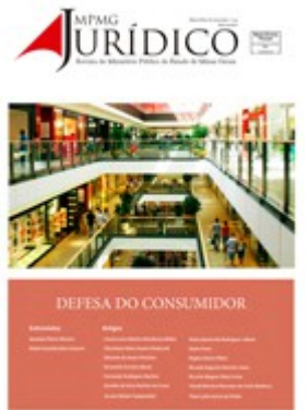
Defesa do Consumidor