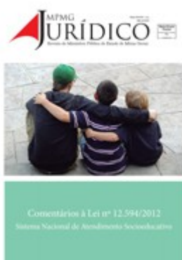
Comentários à Lei nº 12.594/2012 Sistema Nacional de Atendimento Socioeducativo