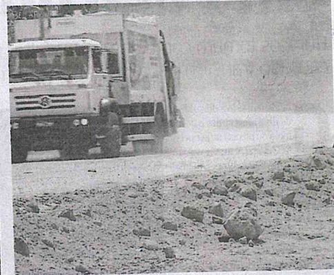
MA-386, a Estrada do Arroz, na Região Tocantina, é desafio para motoristas

P elo menos três rodovias estaduais, inauguradas nos últimos quatro anos pelo Governo do Maranhão, tiveram danos graves após fortes chuvas. Entre os meses de março e abril deste ano, as MAs 012 (que liga os municípios de Barra do Corda e São Raimundo do Doca Bezerra), 315 (que integra a Rota das Emoções e perpassa os municípios de Barreirinhas a Paulino Neves) e 386 (entre Imperatriz e Cidelândia) ficaram com tráfego comprometido. Para as obras, que já estão se deteriorando, o governo retirou dos cofres mais de R$ 100 milhões, além de receber investimentos da iniciativa privada.