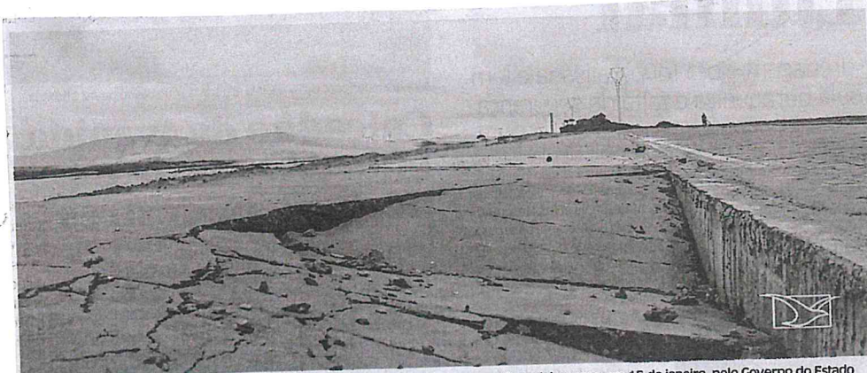
MA-315 com o pavimento deteriorado, mesmo tendo sido entregue há pouco mais de dois meses, em 15 de janeiro, pelo Governo do Estado