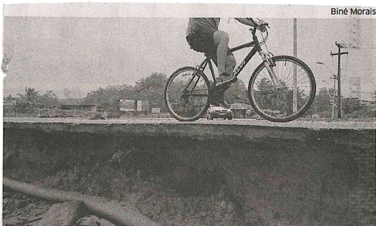
Alheio ao perigo, ciclista pedala em trecho que cedeu na Av. Litorânea