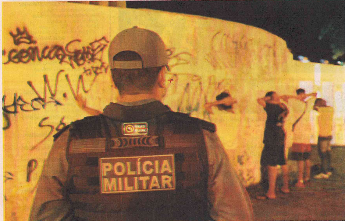
Abordagem de policiais do BPTur na região do Centro Histórico

O resultado positivo se deve também às novas modalidades de policiamento implementadas pelo batalhão desde o final do ano passado. Policiais em bicicletas, por exemplo, tornaram mais eficiente o atendimento policial nas áreas em que atuam, o que contribuiu para o aumento da presença policial. Para o comandante do BPTur, coronel Honório de Carvalho, o resultado positivo mostra a