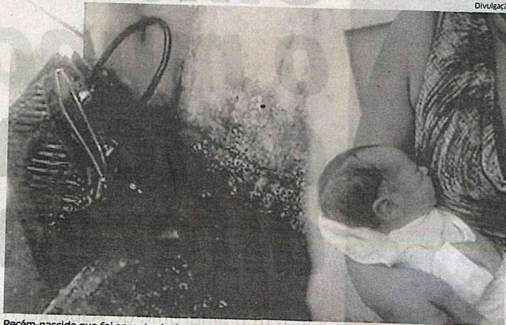
Recém-nascido que foi encontrado dentro de uma bolsa, na Cidade Operária; mãe ainda é desconhecida

A polícia já está analisando imagens de câmeras de vídeo de residências da Rua 5 e já solicitou de todas as maternidades da Região Metropolitana de São Luís, informações sobre as parturientes que deram en-