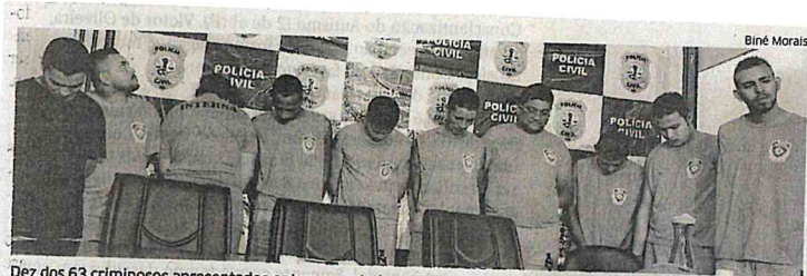
Dez dos 63 criminosos apresentados ontem em coletiva na sede da Secretaria de Segurança Pública do Maranhão