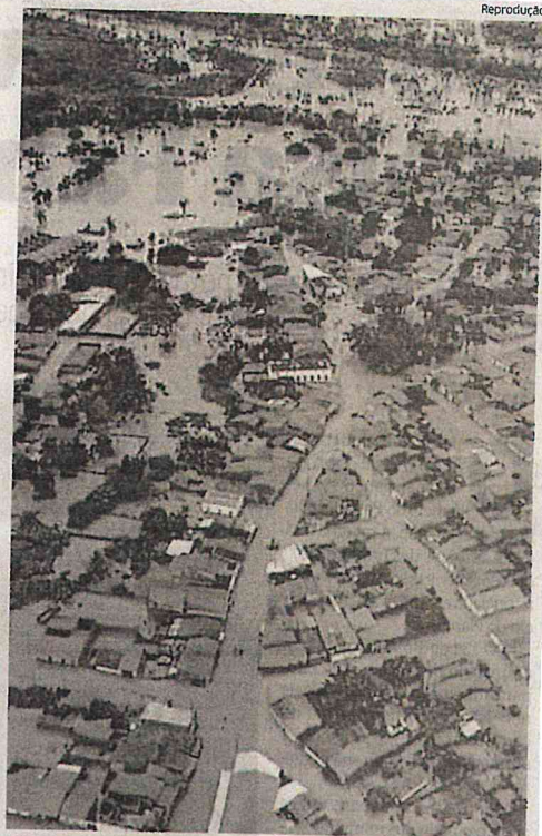
Imperatriz teve ruas alagadas pela chuva, na madrugada de sexta-feira

"O estado como um todo tem sido duramente castigado com o excesso de chuvas, muito acima da média. Os bombeiros têm atuado