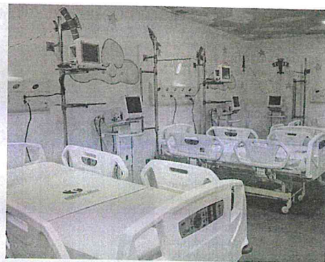
Leitos da internação oncopediátrica serão desativados no hospital

Conforme a direção do hospital, o convênio foi encerrado e a Fundação Antonio Dino tem feito investimentos em construções, ampliações