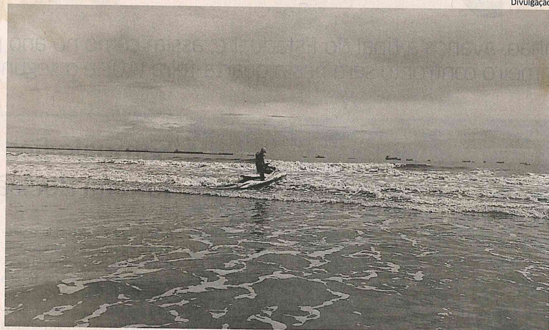
Bombeiro Militar percorreu por todo o dia de ontem, a orla marítima em busca do homem desaparecido

Os bombeiros também orientam os banhistas a evitar certas ati-