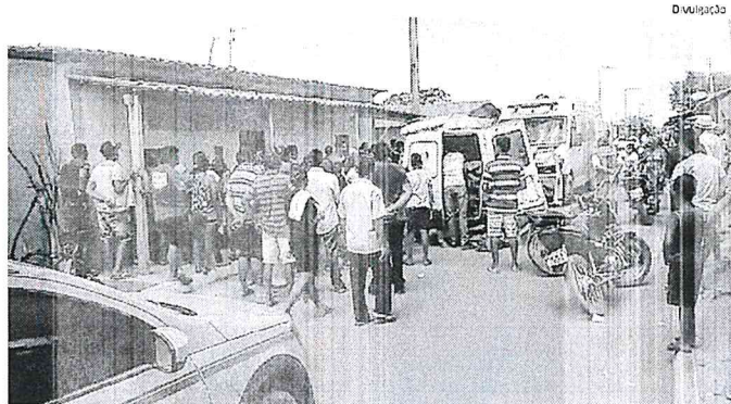
Corpos das vítimas do acidente na BR-226, em Caxias, no momento em que chegaram a Sucupira do Norte