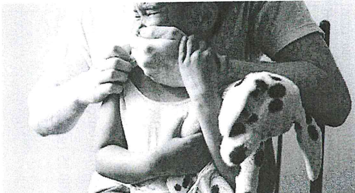
Em 15 anos, 2017 teve mais registros dessas práticas delituosas, que violam o direito da vítima de até 17 anos

Casos de abuso, violência e exploração sexual contra crianças e adolescentes têm seguido em linha vertical em todo o Maranhão. Em São Luís, a exemplo e como reflexo, desde 2004 os números vêm crescendo, embora tenham sido registrados pequenos decréscimos em quatro anos durante um período de 15 anos, conforme evidência um levantamento realizado pelo CPTCA, órgão ligado Centro de Apoio Operacional da Infância e Juventude (CAOPIJ), vinculado ao Ministério Público do