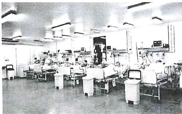
PREFEITO EDIVALDO JÚNIOR IMPLANTA MELHORIAS NO SOCORRÃO II

Com o comprometimento da equipe envolvida e dos profissionais o hospital Socorrão II se destacou entre todos os participantes do programa como o de melhor resultado. O nosso agradecimento a todos que contribuem para que possamos oferecer o melhor à população", destacou o prefeito