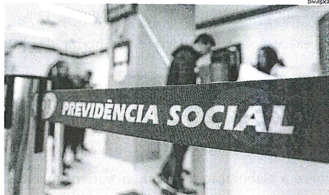
Atualmente, segundo TCE e MPMA, 43 municípios do Maranhão adotam regime próprio de previdência social