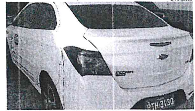
Carro roubado de um taxista pelos bandidos foi achado no Anil

O bebê estava deitado em uma rede na residência dos pais quando desapareceu na madrugada do dia 21. Os pais da criança somente perceberam o desaparecimento no período da manhã e acionaram os conselheiros autênticos e os policiais militares. Ainda nesse dia, populares, familiares e militares realizaram buscas na cidade, visando localizar a criança. ●