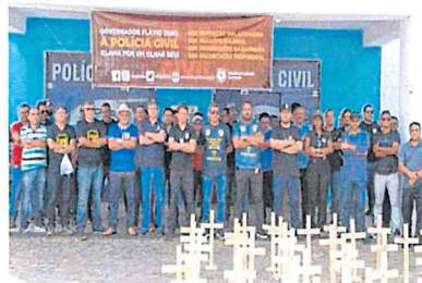
Policiais civis cruzaram os braços em manifestação contra o governo

O deputado estadual Adriano Sarney (PV), levou o caso dos policiais civis para debate na manhã de on-