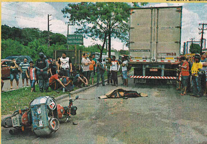
Uma das hipóteses para o acidente é que o caminhão tenha desviado de buracos na pista, passando por cima do motociclista