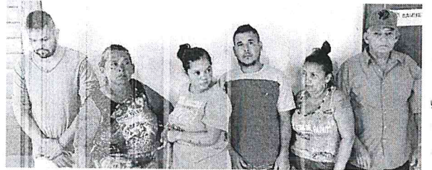
Seis pessoas presas em Carutapera vão responder pelos crimes de tráfico de drogas e porte de armas