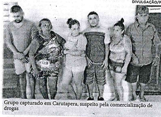
Grupo capturado em Carutapera, suspeito pela comercialização de drogas

A Superintendência Estadual de Repressão ao Narcotráfico (Senarc), com o apoio de outras unidades da Polícia Civil, realizou, durante a terça-feira (9), a "Operação Gurupi", na cidade de Carutapera, em cumprimento a mandados de busca e apreensão. No total, foram presas seis pessoas, entre homens e mulher, envolvidos com a comercialização de armas de fogo e drogas, que foram apreendidas nas incursões. O delegado Breno Galdino, titular da Senarc, frisou que as equipes fizeram levantamentos, nas últimas semanas, sobre a intensa venda de armamentos e entorpecentes na cidade, em pontos considerados mais críticos. Como resultado