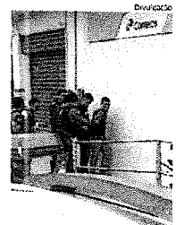
Bandidos quando eram levados por policiais para a delegacia

Populares acabaram se aglomerando no local com o objetivo de saber informações sobre o caso. Em um determinado momento, os bandidos efetuaram tiros dentro da agência, ocasionando tumulto. Muitos moradores correram com receio