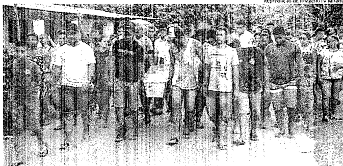
Sepultamento de um dos três adolescentes assassinados na localidade Coquinho, em São Luís, em janeiro

O Monitor da Violência ainda não contabilizou os dados do mês de junho, mas, segundo relatório da Secretaria de Segurança Pública do Maranhão (SSP), 26 mortes foram registradas na grande São Luís. No