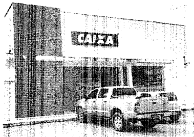
Agência da Caixa Econômica Federal assaltada na madrugada desta sexta-feira

Os policiais militares estiveram no local e encontraram as ferramentas utilizadas pelos criminosos, que foram apreendidas na sede da Superintendência Estadual de Investigações Criminais (Siec), no