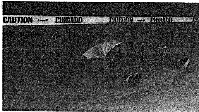
DESDE JANEIRO, OS CRIMES DE HOMICÍDIOS VÊM DIMINUINDO NA GRANDE ILHA

Ele disse que os homicídios na Região Metropolitana de São Luís tiveram o seu processo cíclico até 2014, quando se registrou maior número de ocorrências em função do tráfico de drogas estar ocupando uma posição dominante nas cidades. Os crimes se davam em face dos conflitos pela posse dos pontos geográficos de distribuição das drogas. Depois disso, com as forças de segurança se revitalizando e partindo para um efetivo confronto com os traficantes, se observou uma acomodação dos conflitos. Desde de 2015, a Superintendência Esta-