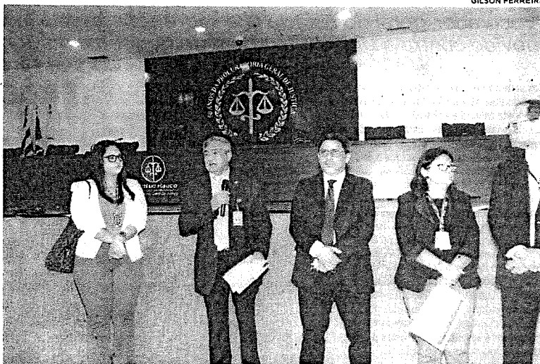
Representantes do MPMA falam para gestores municipais sobre a importância da correta arrecadação dos tributos