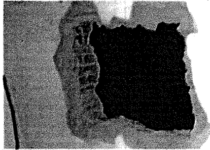
Buraco feito na parede da Caixa Econômica pelo qual os assaltantes tiveram acesso à parte interna do banco

Conforme o major Clodoaldo Silva, comandante do 8º Batalhão de Polícia Militar (BPM), os assaltantes pularam o muro de um terreno baldio, por volta das 2h, e fizeram o buraco nos fundos da agência. Já dentro, eles tiveram