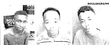
Suspeitos presos por militares do 9º BPM, na Alemanha, depois de assaltarem ônibus