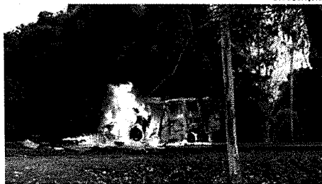
Veículo de transporte de passageiros pegou fogo, e o motorista morreu carbonizado

Na manhã de sexta-feira (13), um acidente envolvendo uma mini van e uma caminhonete, entre as cidades de Caxias e Senador Alexandre Costa, na BR-226, resultou em duas mortes. Inicialmente, a Polícia Rodoviária Federal (PRF) informou que tinham sido três falecimentos, mas depois corrigiu, diminuindo somente para duas. De acordo com as primeiras