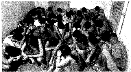
Suspeitos presos durante a Operação Volgus, em cidades do Maranhão e do Tocantins

A Polícia Civil realizou, na quinta-feira (12), durante a operação intitulada Volgus, o cumprimento de diversos mandados de prisões e, ainda, de mandados de busca e apreensão. No total, 38 pessoas foram presas, sendo que 21 delas já estavam custodiadas em Unidades Prisionais de Imperatriz, Davinópolis, São Luís e Balsas. De acordo com a polícia, o objetivo da operação foi desarticular organizações criminosas voltadas à prática de crimes de tráfico e associação ao tráfico de drogas. Na ocasião, seis grupos foram identificados durante os quatro meses de investigações, feitas pelo Departamento de Narcóticos de Imperatriz. A operação contou com ações