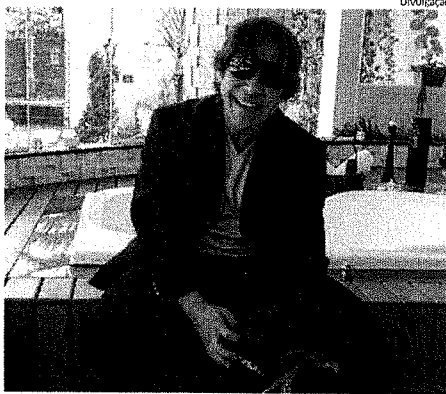
Juiz Fernando Cruz foi achado morto na piscina de casa, no Olho d'Água

No último dia 9, a polícia registrou um caso de crime dessa natureza na capital maranhense. A vítima foi o juiz da 7ª Vara Criminal de São Luís, Fernando Luiz Mendes Cruz, de 50 anos. A polícia informou que o magistrado estava de férias e foi encontrado morto na piscina da sua residência, no bairro Olho d'Água. O corpo foi achado no período da manhã por uma das empregadas do magistrado. Ela acionou o Centro Integrado de Operações de Segurança (Ciops), que mobilizou policiais militares e civis, Corpo de Bombeiros Militar e os peritos do Instituto de Criminalística (Icrim).