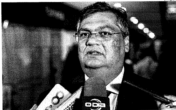
Governo Flávio Dino segue tentando, no Tribunal de Justiça, derrubar decisões favoráveis a servidores

Segundo o Sindicato dos Trabalhadores no Serviço Público do Estado do Maranhão (Sintsepe), pelo passivo da ação, a decisão atinge mais de 60 mil servidores estaduais. Quando da concessão da liminar, a entidade estranhou o encadeamento de fatos.