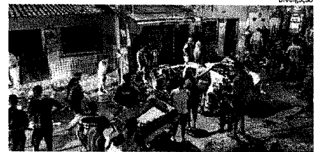
Subiu para cinco o número de mortes causadas por grave acidente

Ainda nesse mês, a polícia, encontrou, com o auxílio de populares, mais duas ossadas humanas. Uma delas, no dia 26, no Calhau. A outra, dia 21, no Turibua, em São José de Ribamar. Em plena manhã do dia 18, pescadores encontraram um homem morto, na praia do Pucal, no município da Raposa. Os casos estão sendo investigados pela equipe da SHPP. ●