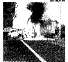
Um dos veículos envolvidos no acidente pegou fogo na pista

Populares encontraram na manhã de sexta-feira, 13, o corpo de um homem, em uma área de terreno baldio, no Alto Turu, e acionaram a