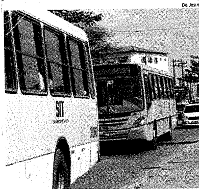
Ônibus de consórcio estariam com mais de uma década de uso