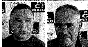
Suspeitos presos pela Operação Cifra Negra, entre os quais estão três policiais militares maranhenses

Uma operação da Polícia Civil, denominada "Cifra Negra", resultou na prisão de três policiais militares e outras doze pessoas suspeitas de envolvimento em diversos crimes na região da baixada maranhense. A ação policial ocorreu nas cidades maranhenses de Viana, São Luís, Matinha e Penalva; e, ainda, no estado do Mato Grosso. No total, foram expedidos 30 mandados de busca e apreensão e 24 mandados de prisão. O objetivo da operação foi desarticular uma associação criminosa envolvida em diversos homicídios, tráfico de drogas e porte ilegal de arma de fogo na região. De acordo com o superintendente de Polícia Civil do Interior, delegado Guilherme Campelo, a investigação contra o grupo teve início em fevereiro de 2019. "Após quase seis meses de investigação, foi possível identificar os membros mais atuantes e que compõem o grupo criminoso que age na cidade de Viana e regiões vizinhas,