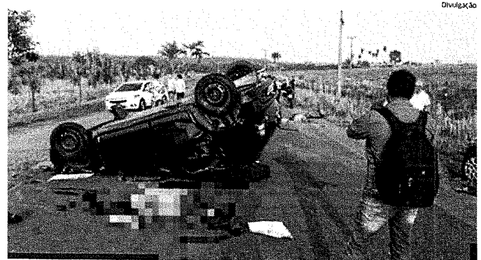
Veículo envolvido no acidente, que vitimou três pacientes que fariam hemodiálise em Imperatriz

O caso vai ser investigado pela Polícia Civil. Os corpos das vítimas foram removidos para o Instituto Médico Legal de Imperatriz para serem autopsiados e, logo após, liberados para os familiares. ●