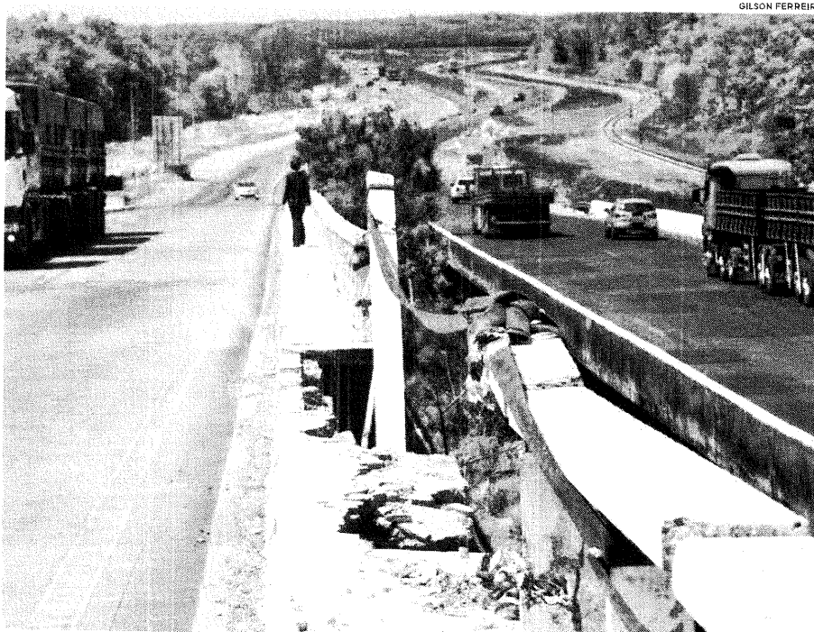
Grade de proteção da Ponte Marcelino Machado continua quebrada, desde colisão com um caminhão, no mês de outubro passado

Faço ao exposto acima, esclarecemos que o DNIT já está providenciando a realização de processo licitatório para a contratação da empresa que vai fazer os reparos necessários, o que demanda um certo período de tempo" (Equipe Asccon - DNIT/MA).