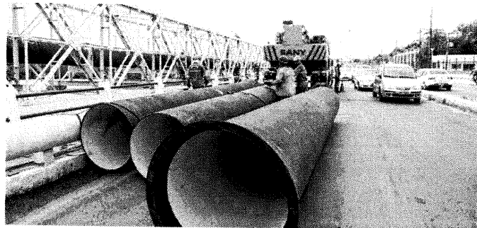
Adutora se rompeu, na Barragem do Bacanga, no dia 25, e nova tubulação está sendo colocada no lugar

Recentemente, bairros da área Itaqui-Bacanga foram afetados com interrupção no abastecimento; apesar da nova adutora, os problemas continuam na região