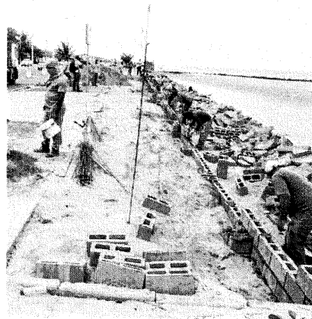
Reforma do calçadão do prolongamento da Litorânea foi iniciada

Perto do calçadão que cedeu, continua sendo feito o trabalho de reestruturação da Avenida Litorânea, que vai interligar as praias de São Marcos, Calhau, Caolho e Olho d'Água.