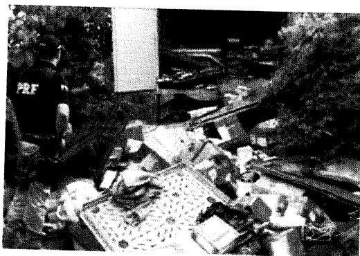
PARTES DA CARGA DO CAMINHÃO FOI LEVADA PELOS BANDIDOS E A OUTRA ABANDONADA

A Polícia Militar e a Polícia Rodoviária Federal (PRF) foram acionadas, mas não conseguiram localizar os bandidos. Agentes da Polícia Rodoviária Federal, Unidade da Lagoa Verde em Imperatriz, registraram a ocorrência e encaminharam o motorista para a Delegacia Regional de Polícia