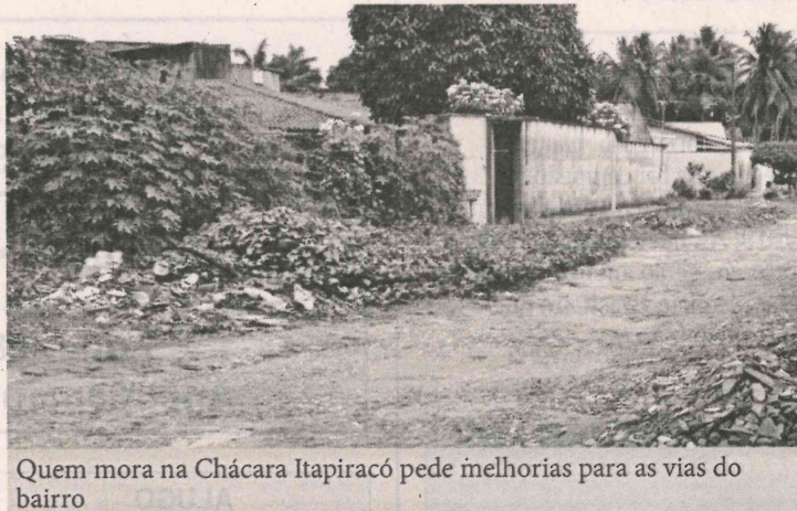
Quem mora na Chácara Itapiracó pede melhorias para as vias do bairro

“É um trabalho de formiguinha. Vamos aos poucos falando com vereadores, deputados. Mas, eles