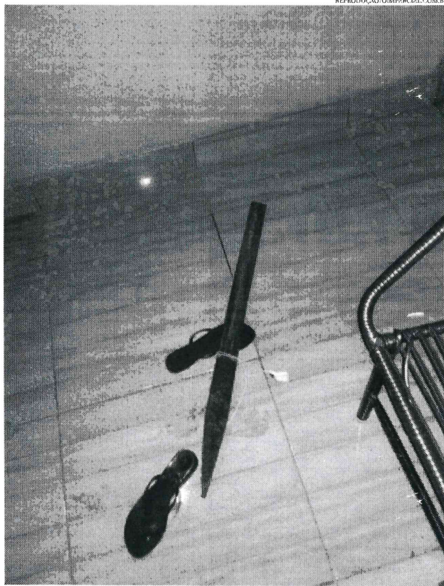
APÓS O ESTUPRO, OS CRIMINOSOS DEGOLARAM O MARIDO E UM AMIGO DA MULHER

De acordo com a autoridade policial, os criminosos estupraram a mulher e depois ainda obrigaram ela a