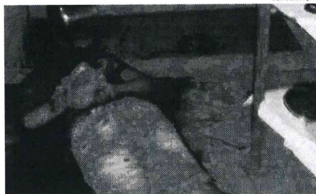
Um dos homens que foi degolado, durante assalto a residência, na cidade de Grajaú