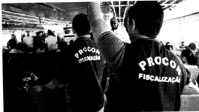
Fiscais do Procon/MA vistoriam embarcações da Internacional Marítima e da Servi Porto

O valor da multa foi estipulado conforme as diversas irregularidades encontradas em ações preventivas de fiscalização nos dois terminais hidroviários, realizadas pelo Procon/MA, com apoio de outros órgãos do governo do Estado, como a Agência Estadual de Mobilidade Urbana e Serviços Públicos (MOB) e a Empresa Maranhense de Administração Portuária (Emap). As irregularidades constatadas, ausência de sinalização do horário de viagem e identificação do passageiro no bilhete; não emissão de nota fiscal na venda das passagens; não fixação de preços e ausência de informação prévia e clara sobre as formas de pagamento. Também foi constatada venda de produtos impróprios para o consumo, más