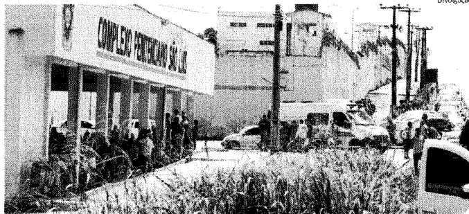
Complexo Penitenciário de Pedrinhas com suas unidades superlotadas, segundo o Mapa da Violência

Os dados foram levantados pelo G1 via assessorias de imprensa das secretarias de Administração Penitenciária e por meio da Lei de Acesso à Informação. O último Levanta-