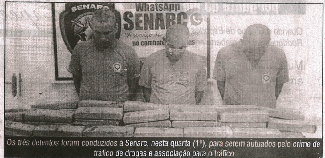
Os três detentos foram conduzidos à Senarc, nesta quarta (1º), para serem autuados pelo crime de tráfico de drogas e associação para o tráfico

“Há cerca de 15 dias tive informações de que uma oficina mecânica na Avenida Santos Dumont ainda funcionava como ponto de armazenamento de drogas. Sendo o mesmo local onde um trio foi preso, em dezembro do ano passado, com aproximadamente 100 quilos de maconha. E, embora presos, temos conhecimento de que eles ainda continuavam a exer-