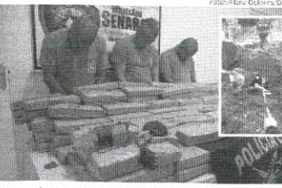
Droga pertencente aos apenados foi achada com uso de cão farejador