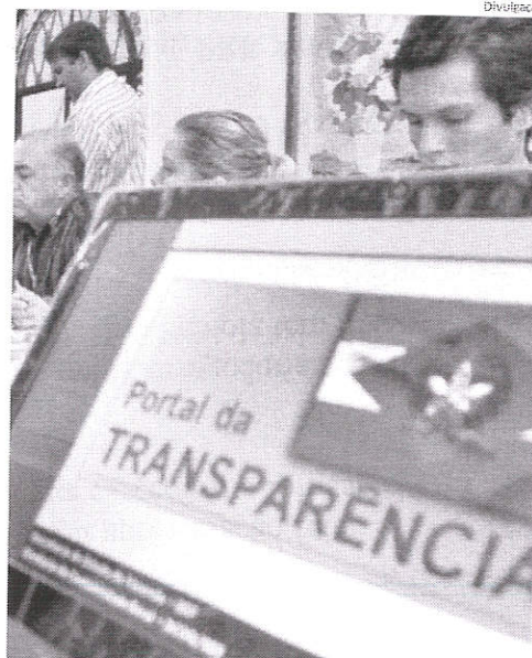
Portal da Transparência é uma exigência da lei para poderes públicos

O documento divulgado pelo TCE faz uma análise completa do sistema de transparência fiscal de cada município e das câmaras municipais maranhenses; e aponta os problemas mais frequentes encontrados em cada portal. Mas algumas prefeituras sequer implantaram o portal da transparência.