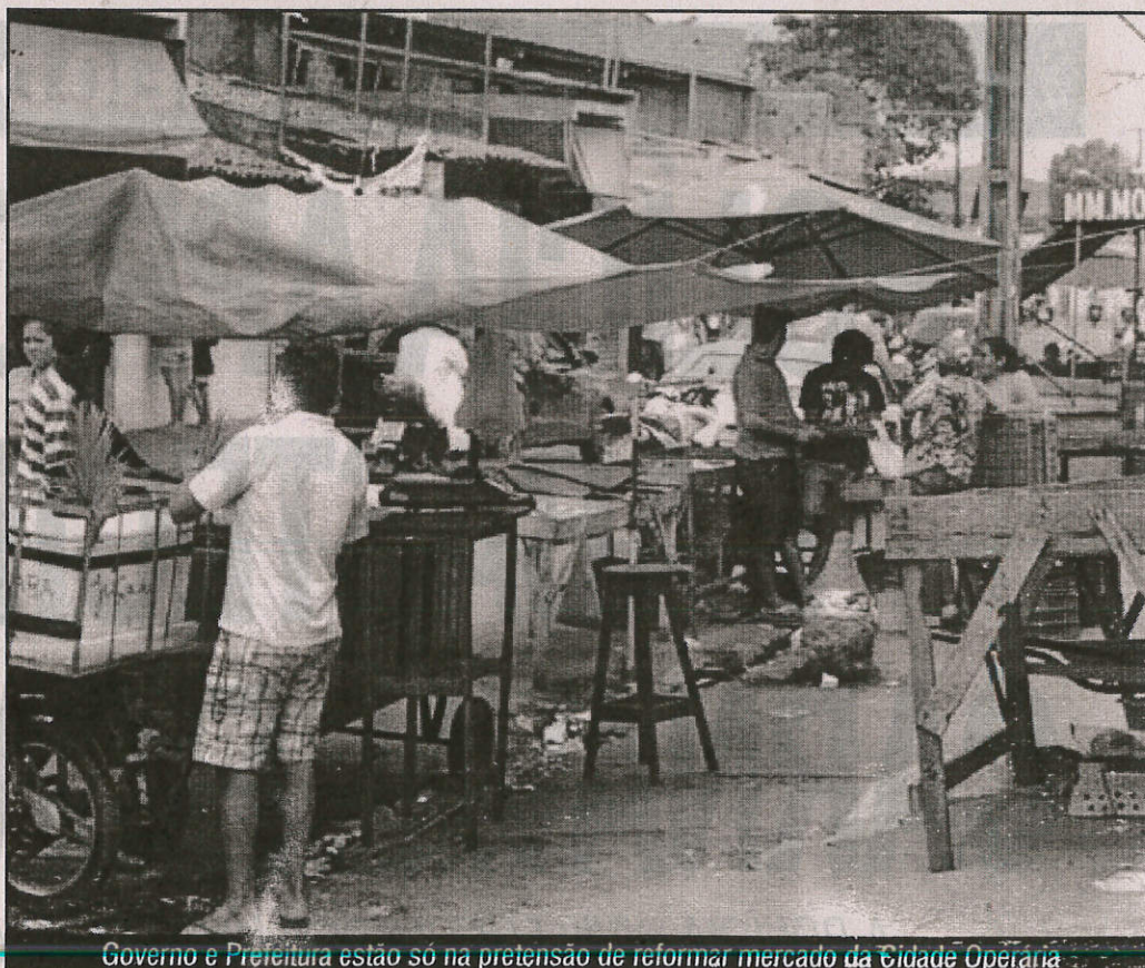
Governo e Prefeitura estão só na pretensão de reformar mercado da Cidade Operária

"A reforma do mercado da Cidade Operária é uma prioridade para o governo. E