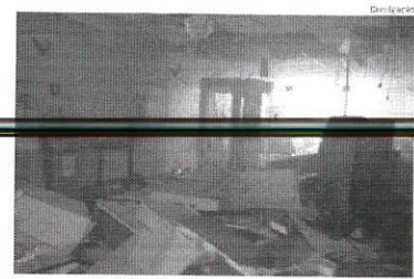
Interior da agência bancária do BB em Bom Jardim ficou destruído