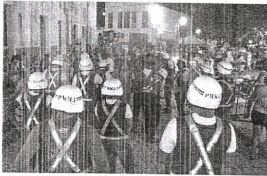
O policiamento foi reforçado nos pontos de folia durante este período nos acessos à capital maranhense

"Montamos um planejamento para que o folião que decidir brincar o carnaval fora da capital possa sair da cidade com total tranquilidade. As ações, também, vão garantir segurança para os turistas que entram em São Luís. Além de