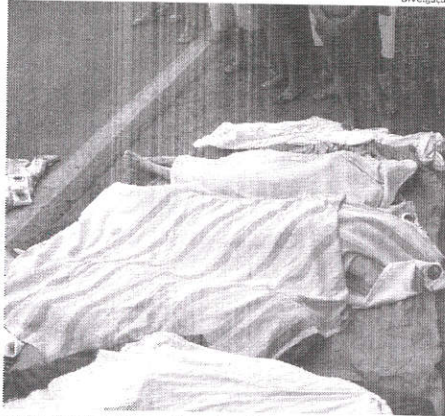
Corpos dos cinco jovens vítimas de acidente na BR-135, no sábado