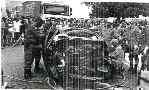
Os cinco jovens mortos no acidente estavam indo para o carnaval em Santa Luzia do Tide