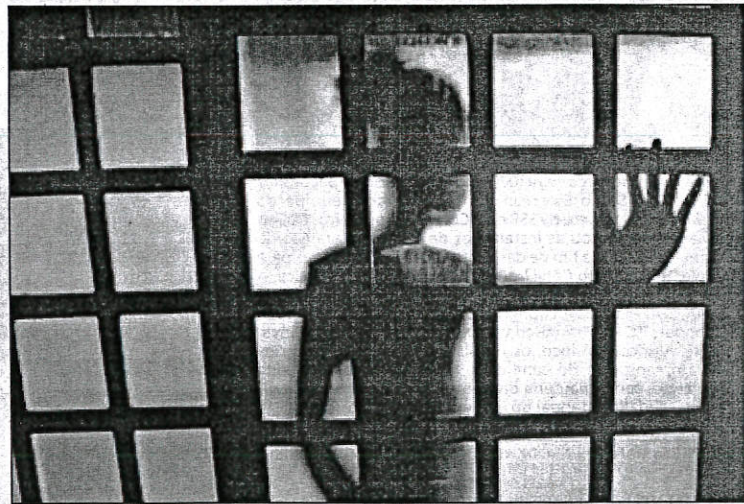
O estudo, divulgado ontem, foi feito com entrevistas presenciais em 130 municípios brasileiros

A cada três brasileiros, incluídos homens e mulheres, dois presenciaram algum tipo de agressão a mulheres em 2016, desde violência física