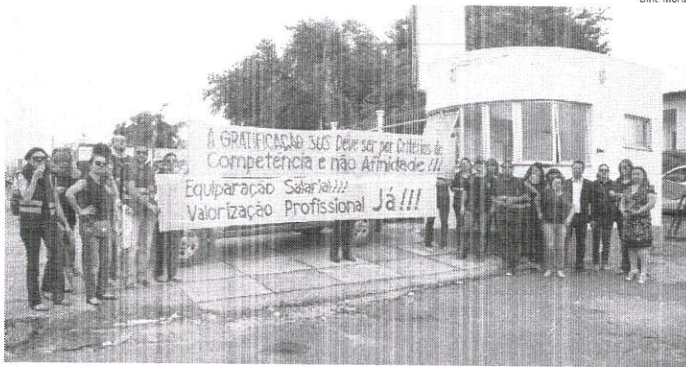
Fiscais sanitários se reuniram na sede do órgão, na Avenida dos Franceses, na manhã de ontem, para protestar

rezinha Lôbo, acompanhou a manifestação e chegou a conversar com alguns fiscais, mas informou que apenas a Semus poderia se manifestar sobre o protesto da manhã de