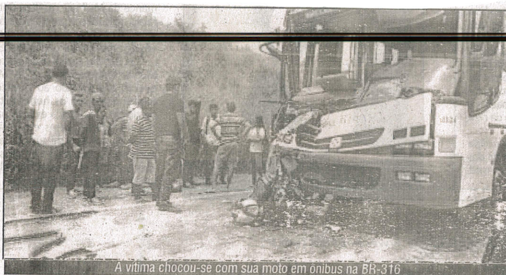
A vítima chocou-se com sua moto em ônibus na BR-316