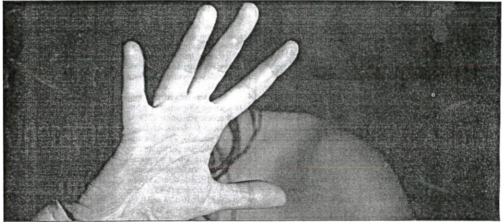
Os acusados foram prestar depoimentos e devem aguardar o posicionamento do Poder Judiciário