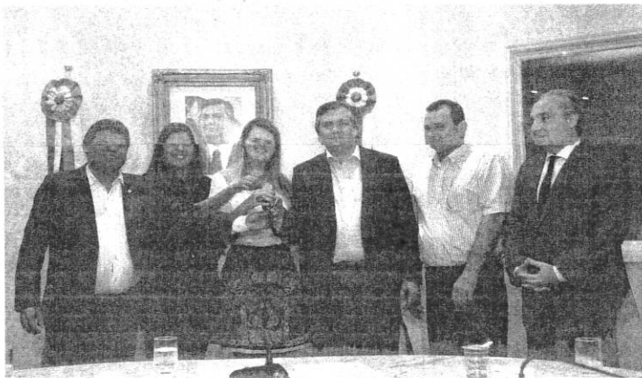
A entrega das ambulâncias foi realizada no Palácio dos Leões com os prefeitos dos municípios contemplados

De acordo com Flávio Dino, quando “entregamos uma ambulância estamos dando acesso do cidadão no sistema de saúde. Estamos impactando no nosso custeio. Mas estamos fazendo isso de modo correto, pois estamos fazendo isso com senso de justiça social”. O objetivo do Governo do Estado é que até 2018 todos os municípios maranhenses recebam pelo menos uma ambulância. Os veículos têm capacidade para socorro no atendimento como Unidade de Terapia Intensiva (UTI) e semi UTI, podendo se transformar em Unidade de Suporte Avançado (USA).