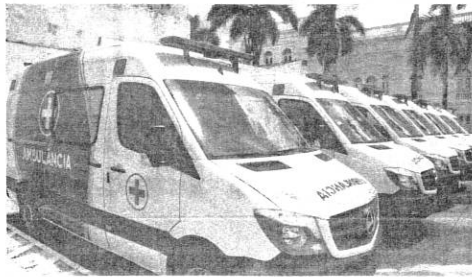
Ao todo, o governo do estado já entregou 44 novas ambulâncias este ano