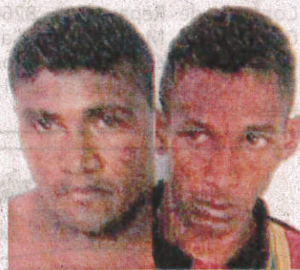
Dupla capturada na Cohab após roubo de carro e invasão de casa

O capitão disse que os dois homens, durante a perseguição, abandonaram o carro, modelo Fiat Uno Mille vermelho, de placa NMY-6005, e entraram rapidamente na casa, nas proximidades do Rio Anil Shopping, e, sem alternativas de