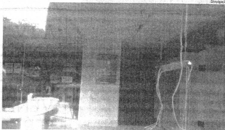
Agência do Bradesco em Itinga do Maranhão foi destruída pelos quadrilheiros na madrugada de ontem

No mês passado, não foi registrada nenhuma explosão de banco, com exceção de uma tentativa, que aconteceu no dia 17 de abril, também contra o Bradesco, na cidade de Imperatriz. Com relação à explosão de ontem, a polícia já sabe que o ato foi praticado por sete criminosos, que chegaram à cidade por volta de 1h30 em um veículo