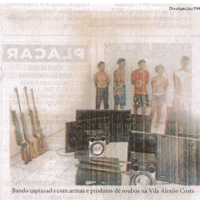
Bando capturado com armas e produtos de roubos na Vila Alonso Costa