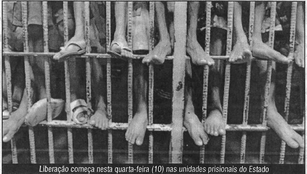
Liberação começa nesta quarta-feira (10) nas unidades prisionais do Estado

A portaria designa ainda reunião a ser realizada nos respectivos estabelecimentos penais para advertências, esclarecimentos complementares e assinatura do termo de compromisso por parte dos apenados. Entre as exigências a serem cumpridas pelos