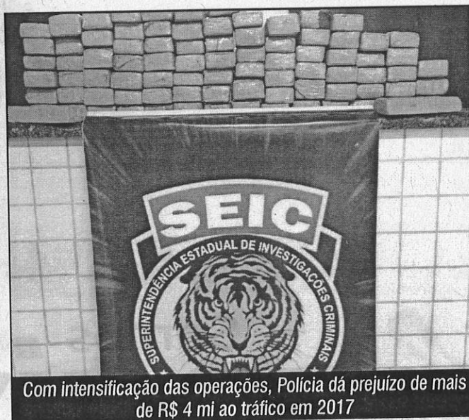
Com intensificação das operações, Polícia dá prejuízo de mais de R$ 4 mi ao tráfico em 2017

“Mais de 30 policiais participaram da ação, considerada a maior operação de erradicação de pés de maconha feita pela polícia no interior do estado nos últimos dez anos”,