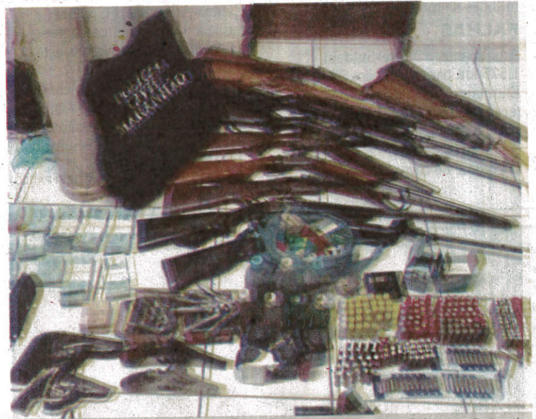
Armas, munições e uma quantia em dinheiro foram apreendidos em Coroatá