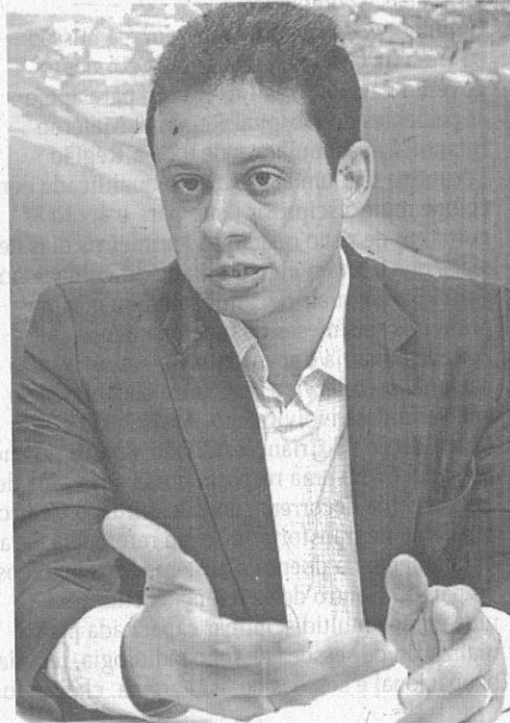
O procurador geral do Estado, Rodrigo Maia, explica ação da PGE contra ex-diretores da Emap

Segundo o governo do Estado, desde 2010 a antiga diretoria da empresa estatal pagava de forma ilegal diretores, coordenadores e parte dos assessores com a instituição de verba denominada "bonificação por desempenho". Explica a PGE que para adotar a política de participação dos funcionários nos lucros ou resultados, as empresas estatais devem estar amparadas em lei e normas, além de serem pactuadas com as entidades sindicais. A Emap possui este programa e paga a seus