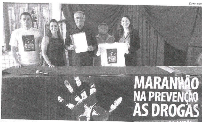
Campanha Maranhão contra as Drogas foi lançada no Centro de Ensino Médio José Neves de Oliveira, em Itinga

Em Buriticupu, o lançamento ocorreu no dia 29 de maio, pela manhã, na Câmara de Vereadores.