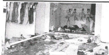
Loja que foi invadida pelo veículo de um militar, dirigido por sua mulher

Além de fevereiro deste ano, a polícia solicitou a prisão dos suspeitos, mas o juiz da Comarca de Buriticupu, nome não revelado, considerou que esse crime teria sido cometido por militares e deveria ser julgado pela Justiça Militar. O mandado de prisão dos acusados somente foi expedido pela Justiça Militar no último dia 30. ●