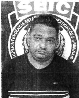
Batata responde por assaltos a bancos, carro-forte e tráfico de drogas

Batata responde a processos por assaltos a bancos, carro-forte e tráfico de drogas em Esperantinópolis, Gonçalves Dias, Passagem Franca, São Domingos, Barra do Corda, Santa Luzia do Itaipé, Eugênio Barros, Carolina, Anapurus, Santa Inês e Porto Franco, todas cidades maranhenses, além de Patapi, Bedençote, do estado do Pará, Paraíba-DF e Vitória-