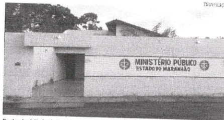
Sede do Ministério Público em Bequimão; TAC foi firmado em maio

Condições observadas em fiscalização levaram a realização de uma audiência para discutir o tema