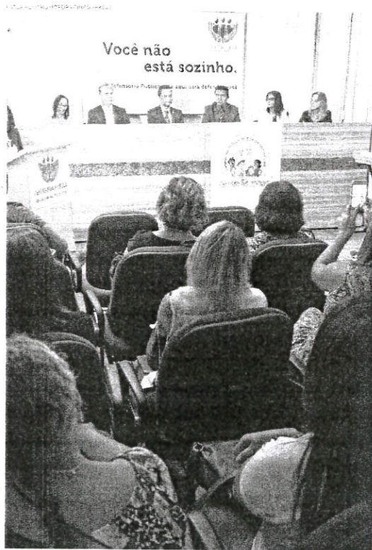
Representantes de órgãos e defesas dos direitos dos idosos juntos para conscientizar população

Assim como as entidades parceiras, para este ano a DPE/MA elaborou uma vasta programação que inclui palestras, pontifegação, roda de conversa, seminário e um grande mutirão nas unidades judiciais maranhenses, envolvendo defensores públicos, juizes, promotores, advogados e demais operadores do Direito, com o objetivo de promover ampla revisão e corresponsabilização dos processos de pessoas idosas.