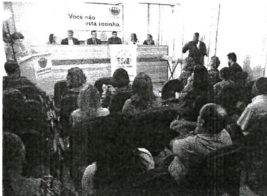
De 2014 até maio deste ano, a Defensoria Pública atendeu mais de 2.800 casos de violência