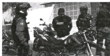
Policiais conseguiram localizar a motocicleta tomada por ladrões