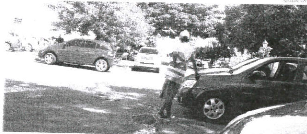
Pelo menos 200 guardadores de carro, que passaram por capacitação e cadastro, atuam no centro de São Luís; eles devem usar coletes e crachás

Há cinco anos a Secretaria de Estado de Segurança Pública realiza o cadastramento e oferece cursos de capacitação para os guardadores de carro