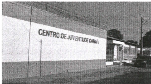
Depois de um homicídio no Centro de Juventude Canaã, outro jovem é morto no Alto da Esperança

Em nota, a Fundação informou que já tomou as medidas cabíveis em relação ao caso. Seguiu-se a instrução, dois outros menores assassinaram ter estrangulado a vítima de ontem, enquanto o primeiro teria morrido por enforcamento.