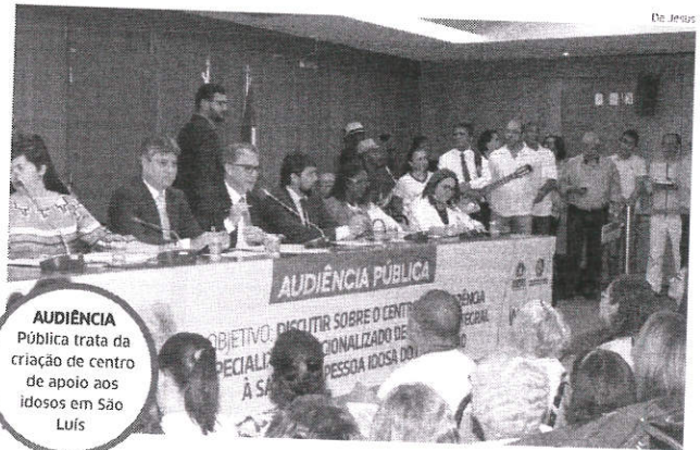
AUDIÊNCIA Pública trata da criação de centro de apoio aos idosos em São Luís

Audiência pública, realizada ontem para tratar do assunto, contou com grande participação de idosos e membros de entidades da sociedade civil