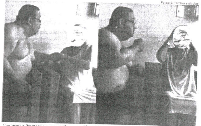
Conforme a Promotoria, as agressões contra idosos são praticadas, em sua maioria, pelos próprios familiares