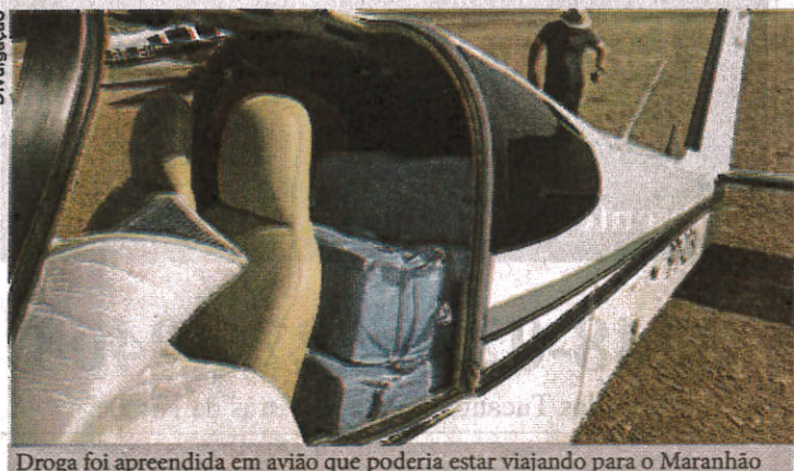
Droga foi apreendida em avião que poderia estar viajando para o Maranhão

barras estavam armazenadas em sacos, sendo que dois brasileiros e um boliviano foram presos em flagrante. Aos investigadores, eles ofereceram versões contraditórias, pois um alegou que o entorpecente foi buscado em Rondônia e outro argumentou que veio da Bolívia. Além da droga, explicou o delegado Gabriel Costa, da PF, os policiais também apreenderam um revólver calibre 38 e a quantia em dinheiro no valor de R$ 4 mil e mais US$ 2,8 mil. Os presos – que são o piloto, o dono do avião e um boliviano – foram levados à sede da PF no Mato Grosso, onde foram autuados em flagrante. (NM)