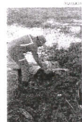
Bombeiro resgata uma das vítimas e examina se está morta

No começo da tarde de ontem, dois veículos, um Fiat Uno, de placa NQM-1290 e um Prato, de placa NQM-1290, colidiram em uma área alagada, deixando uma pessoa morta e três feridas.