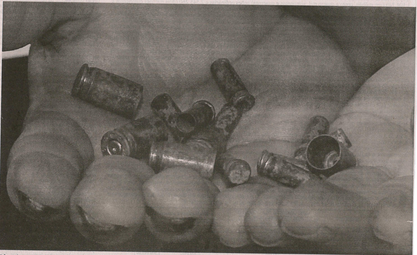
Cápsulas recolhidas em povoados de Formosa da Serra Negra e Grajaú provam a tensão que tomou conta de comunidades rurais

Ano passado, 13 pessoas morreram no estado e os conflitos, ameaças e emboscadas continuam