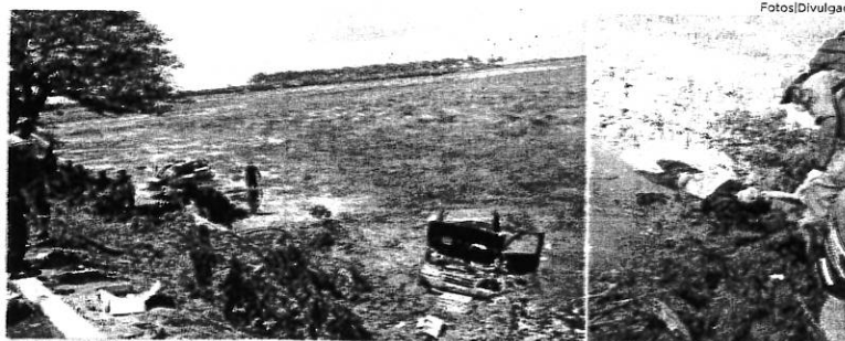
Os dois veículos foram parar no campo alagado, causando a morte de um homem, não identificado até a noite de ontem

Um acidente envolvendo dois automóveis resultou na morte de uma pessoa, no início da tarde dessa quarta-feira (23), pouco depois do meio-dia, como apurado pela reportagem do Jornal Pequeno . O passageiro de um Fiat Uno faleceu em um campo alagado, onde o veículo caiu após uma colisão com outro. A batida aconteceu na cidade de Pinheiro, na Baixada Maranhense. Segundo informações obtidas com o comandante do 10º Batalhão de Polícia Militar (BPM), tenente-coronel Diniz Vasconcelos, o Fiat, de placa NQM-3398/Ceará, bateu em outro veículo, sendo que os dois automóveis caíram no campo alagado, mas somente o passageiro do primeiro morreu. Ele não resistiu, provavelmente,