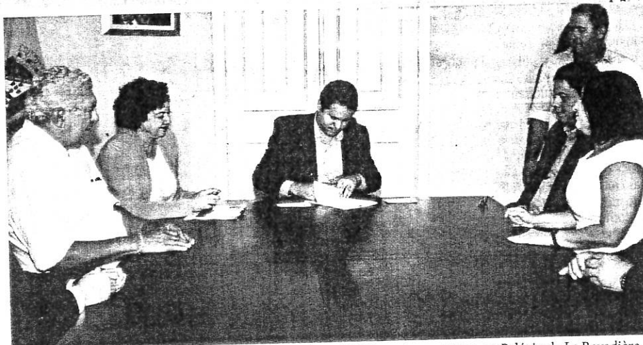
A assinatura do termo entre a Prefeitura de São Luís e o MDS aconteceu ontem, no Palácio de La Ravardiére