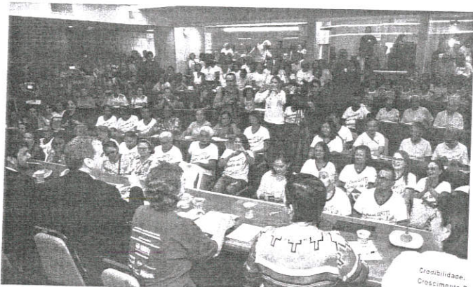
Durante a audiência pública, foram apresentados detalhes sobre a construção do Centro de Atenção Regional à Saúde do Idoso

Dados foram apresentados durante audiência pública sobre o Centro Regionalizado de Atenção Integral à Saúde do Idoso