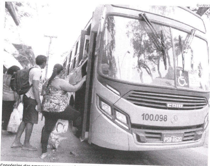
Consórcios das empresas querem reajuste de tarifas no sistema de transporte público de São Luís

Os empresários do setor de transporte alegam que a revisão tarifária é necessária para repor as "perdas de arrecadação" registradas este ano, especialmente com a ascensão de outros serviços como Uber, por exemplo. Algumas empresas já contabilizam prejuízos causados pelo aplicativo