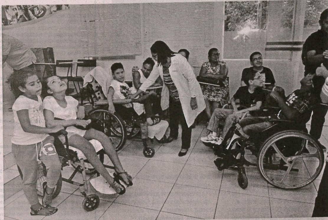
Crianças com deficiência tiveram momentos de descontração, durante evento no Hospital Nina Rodrigues