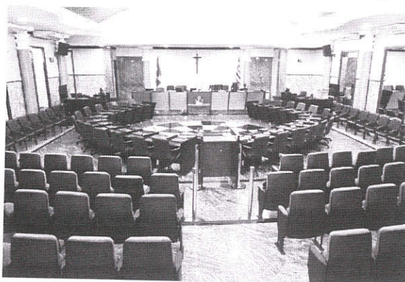
Sessão Plenária Administrativa para a escolha da Mesa Diretora terá início às 9h de amanhã

Esse modelo vem sendo adotado pelo TJMA há pelo menos desde a década de 90. Isso significa que o membro mais antigo é aclamado presidente e, em seguida, são preenchidas as vagas de corregedor e vice com os demais desembargadores. A manutenção da tradição é considerada por membros do Judiciário como algo importante porque as disputas podem atrapalhar o bom andamento do tribunal.