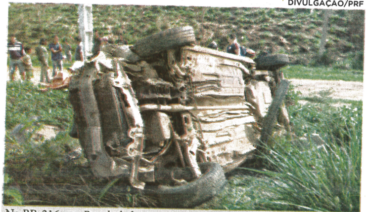
Na BR-316, em Bacabal, foi registrado um capotamento que resultou apenas em uma pessoa ferida

Entre os dias 22 e 25 de dezembro, não ocorreram mortes nas sete rodovias que cortam o Maranhão, de acordo com informações divulgadas pela Polícia Rodoviária Federal (PRF), que realizou durante esse período a “Operação Natal 2017”. Foram registrados 27 acidentes, com 27 feridos, mas sem nenhuma morte no trânsito. Os inspetores fiscalizaram 407 veículos. Conforme a PRF, o fluxo de veículos durante a operação manteve-se normal em todos os trechos, “sem filas, engarrafamentos ou lentidões”. A instituição rodoviária divulgou que mais de mil pessoas foram alcançadas pelos trabalhos educativos desenvolvidos pelos agentes na “Operação Natal 2017”. Em um dos acidentes, que ocorreu no sábado (23) na BR-316, na cidade de Bacabal, um carro modelo Fiat Strada, de cor preta e placa NHP-5954, caiu em uma ribanceira e capotou várias vezes, por volta das 14h30. Três pessoas estavam no veículo, sendo identificadas como