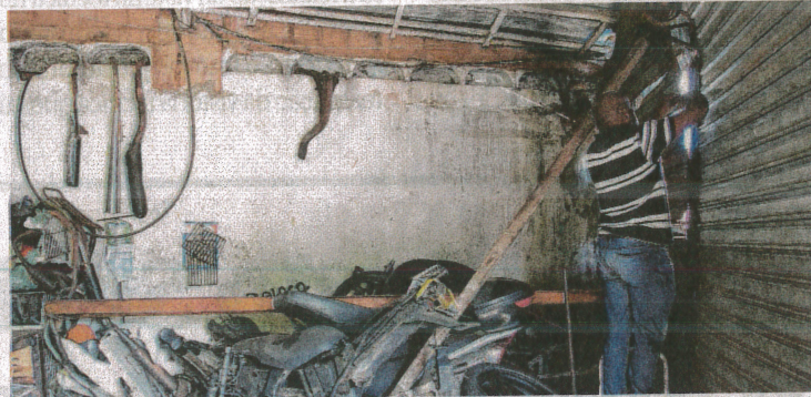
Loja de peças foi arrombada, mas dessa vez nada foi levado

Comerciantes do Monte Castelo trabalham cada vez mais com medo, porque os arrombamentos nos estabelecimentos comerciais têm se tornado frequentes, fazendo com que os donos de lojas e trabalhadores sintam-se revoltados com a situação.