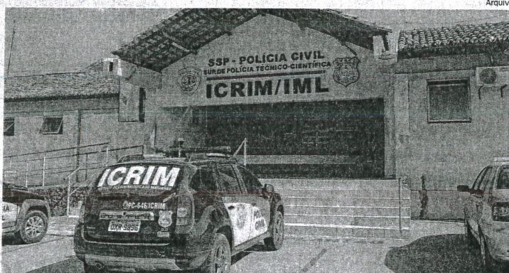
Instituto Médico Legal, no Bacanga, teve neste fim de semana um movimento intenso, com nove mortos

N ove Crimes Violentos Letais Intencionais (CVLIs), conhecidos como homicídios dolosos, foram registrados na Grande São Luís no domingo e segunda-feira, véspera e dia de Natal. Dois ocorreram em São José de Ribamar e os outros sete em bairros da capital. Do total, sete foram praticados por disparos de arma de fogo e dois por arma branca. Os dados foram divulgados ontem, pela Secretaria de Segurança Pública do Maranhão (SSP-MA). São José de Ribamar, Parque Jair