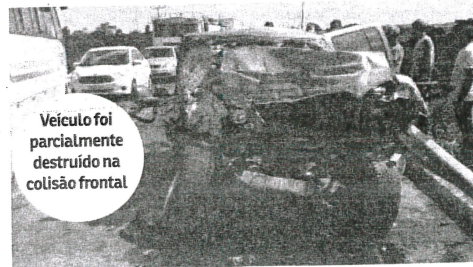
Veículo foi parcialmente destruído na colisão frontal