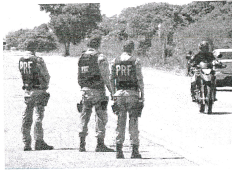
Polícia Rodoviária se faz presente nas estradas do Maranhão

Quatrocentos e sete veículos foram autuados nos quatro dias de operação e 907 pessoas fizeram o teste do bafômetro nas rodovias federais. A PRF registrou ainda um total de 29 acidentes, que resultaram em 27 feridos. 1.183 pessoas foram alcançadas pelas atividades de educação para o trânsito.