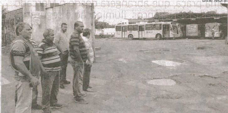
Trabalhadores ficaram na garagem por causa de salários atrasados

Após reunião no SET, empresários afirmaram que pagarão as pendências até o dia 16