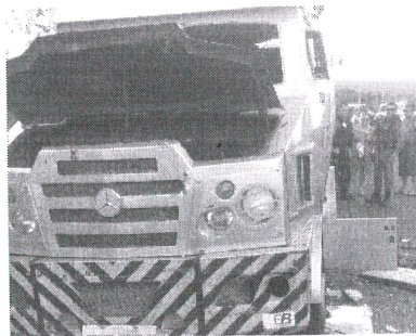
Carro-forte foi parcialmente destruído pelos explosivos

Consta que entre quatro e seis pessoas devem ter participado do assalto e ainda não foi divulgado o volume de dinheiro roubado. As polícias do Maranhão e do Piauí continuam realizando buscas e levantamentos para identificar os assaltantes que fugiram em uma caminhonete prata de placas desconhecidas. O Grupo Tático Aéreo (GTA) continua na área. Os criminosos teriam fugido em direção ao estado do Piauí.