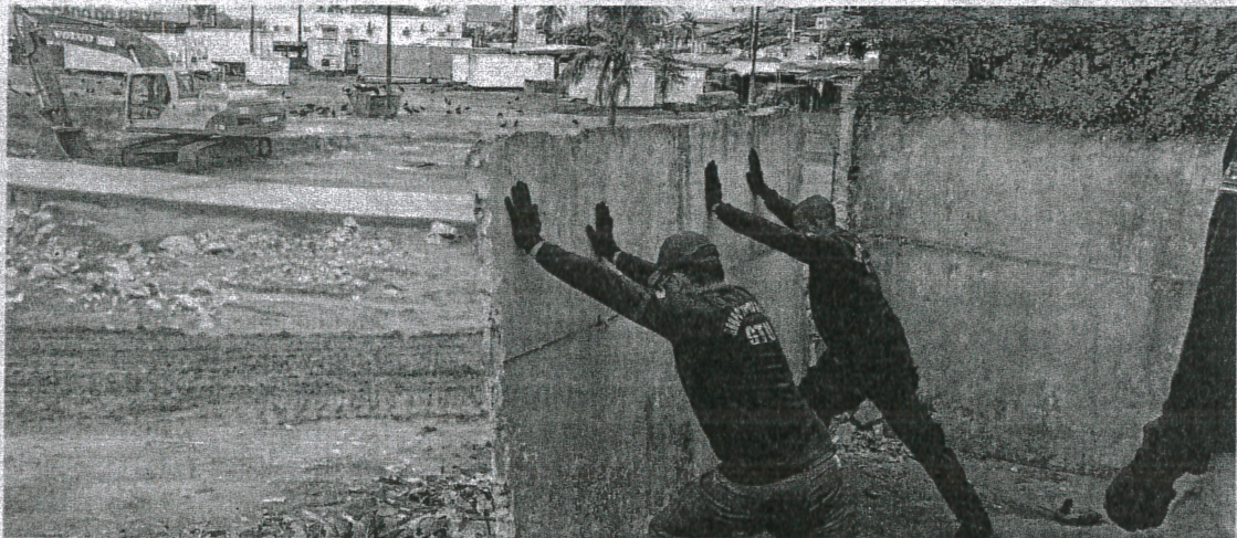
Equipe de operações da Blitz derruba parede de lava-jato que funcionava irregularmente no Anel Viário

Dois pontos comerciais em situação irregular, que funcionavam no Anel Viário, foram retirados, na manhã de ontem, pelo grupo de operações da Blitz Urbana, com o apoio do Grupo Tático Urbano (GTU), e Polícia Militar. Entre os estabelecimentos retirados estavam um lava-jato e a Casa do Coco.