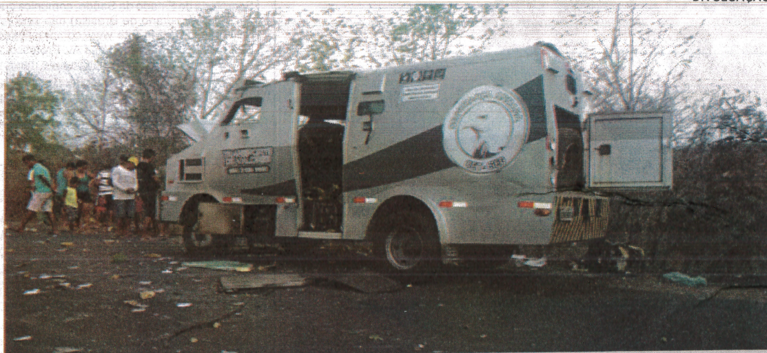
Carro-forte explodido por assaltantes no município de São Bernardo

O Departamento de Combate a Roubo a Instituições Financeiras (Dcrif), da Superintendência Estadual de Investigações Criminais (Seic), continua procurando, juntamente com a Polícia Militar, os bandidos que atacaram um carro-forte da empresa Cet Seg na cidade de São Bernardo/MA na tarde de terça-feira (9). Os criminosos levaram todos os malotes contendo uma grande quantidade de dinheiro. Os assaltantes interceptaram o carro-forte, de placa OVX-9714, do Piauí, no povoado São Raimundo, em uma estrada que dá acesso ao Rio Parnaíba, sendo que o grupo armado com fuzis e outras armas longas chegou em um veículo Toyota SW4, de cor prata, cujo placa seria de Fortaleza/CE. Diante do poder de fogo dos suspeitos, os seguranças da empresa de transporte de valores