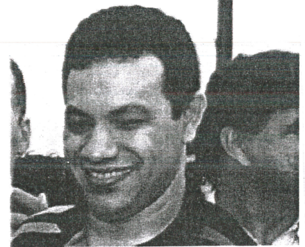
O prefeito Washington Luis foi citado por suposto pregão irregular