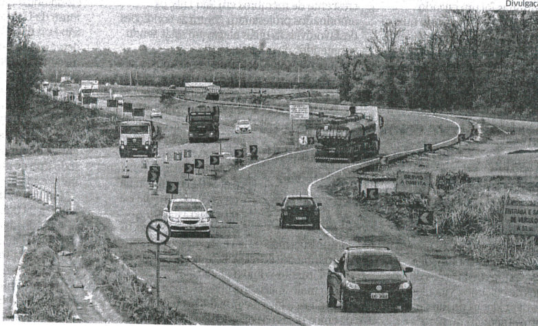
Iniciada em 2010, duplicação da rodovia só continuou por insistência de parte da bancada federal maranhense

A estimativa é de que a obra, que integra o programa Agora é Avançar, do Governo Federal, beneficie diretamente mais de 1,5 milhão de