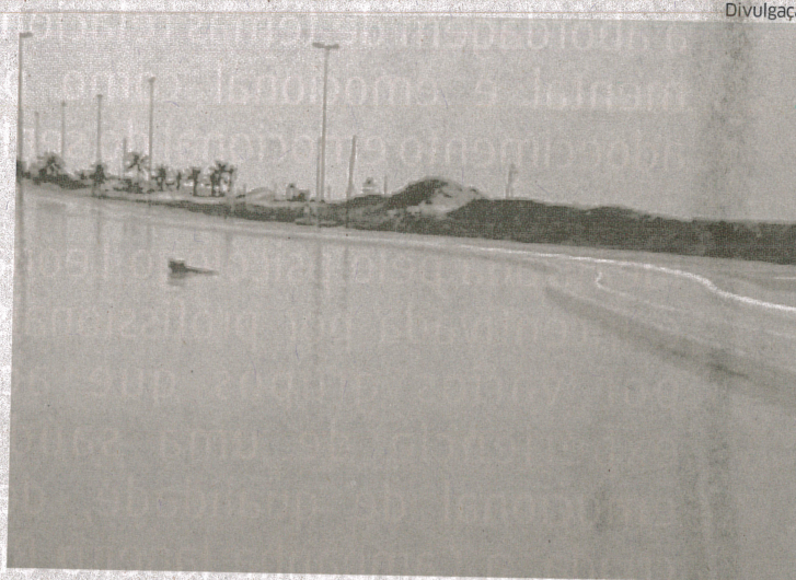
Via ficou alagada após chuva que ocorreu durante a madrugada, na Ilha

com qualquer chuva já fica assim. "A drenagem não foi executada corretamente. Qualquer volume de chuva deixa assim. Vou à Promotoria de Probidade Administrativa fazer uma reclamação formal sobre o problema. Nosso imposto está indo pelo ralo. Até as proteções da ciclovia foram arrancadas", declarou.