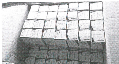
Foram apreendidas 1.500 unidades do antibiótico Flagimax Ped 40mg

doria, o condutor afirmou que adquiriu os medicamentos de uma empresa em Ierésima, no Piauí, sendo entregues pelo filho do proprietário da empresa. Ao ser questionado sobre