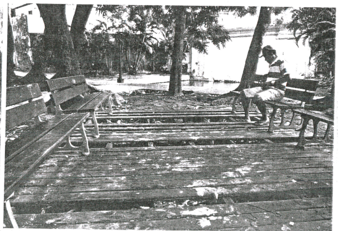
Sinais de abandono e vandalismo podem ser vistos em diversas partes da Fonte das Pedras, principalmente nos banheiros, que estão inutilizados