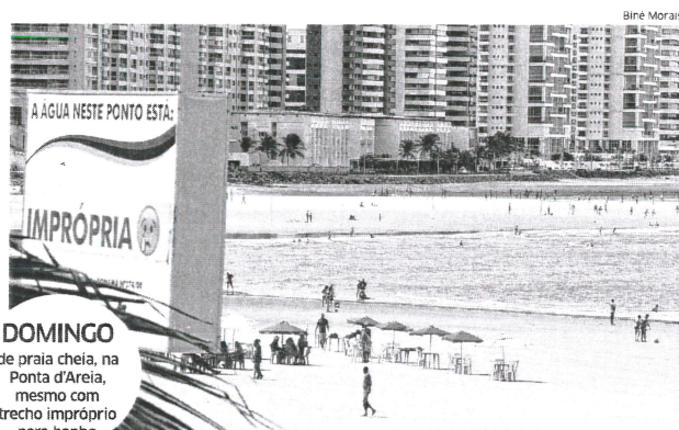
DOMINGO de praia cheia, na Ponta d'Areia, mesmo com trecho impróprio para banho

Apesar de considerada atualmente a praia mais poluída da Ilha,