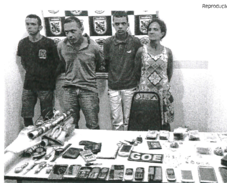
O quarteto foi preso vendendo droga na cidade de Imperatriz

Ao realizarem uma revista, os policiais encontraram droga e efetuaram a prisão dos criminosos.