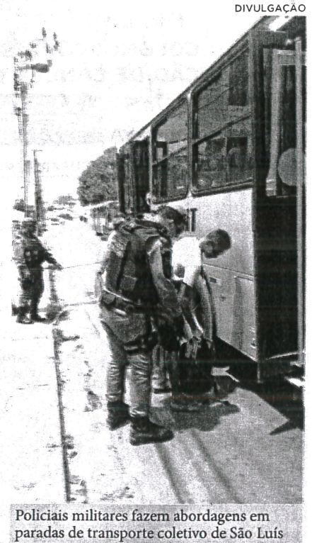
Policiais militares fazem abordagens em paradas de transporte coletivo de São Luís