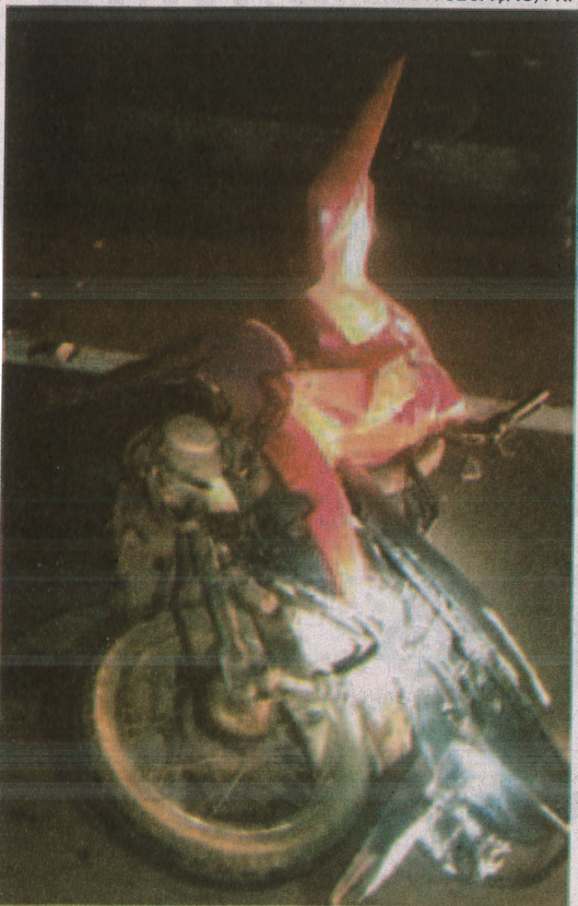
Motocicleta ficou completamente destruída após a colisão com a caminhonete