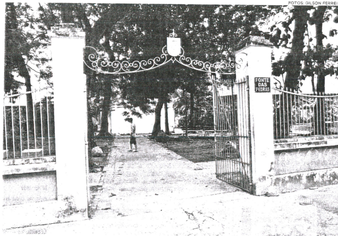
Ponto turístico, que serviu de abrigo para as tropas Jerônimo de Albuquerque, em outubro de 1615, precisa passar por uma revitalização completa

Em 2014, judicialmente a Prefeitura de São Luís foi obrigada a iniciar o controle do uso e acesso à fonte, por meio da implantação de vigilância, além de manter o local limpo,