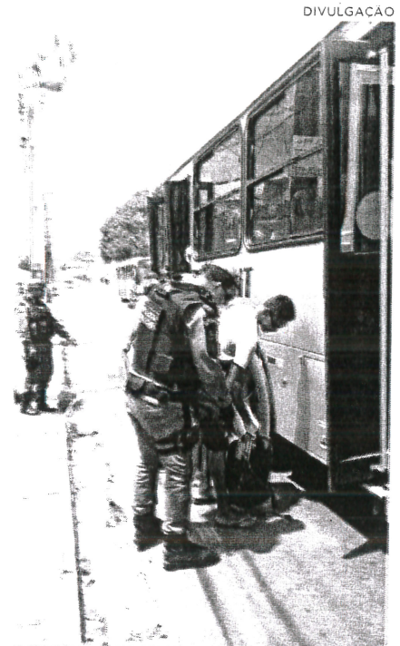
Policiais militares fazem abordagens em paradas de transporte coletivo de São Luís