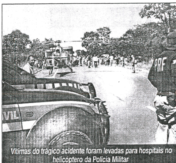
Vítimas do trágico acidente foram levadas para hospitais no helicóptero da Polícia Militar

Segundo o Samu, ambulâncias do suporte avançado e básico de Montes Claros, e unidades de Francisco Sá, Salinas, Cristália e Porteirinha se deslocaram para o local do acidente. Um helicóptero da Polícia Militar auxiliou no socorro