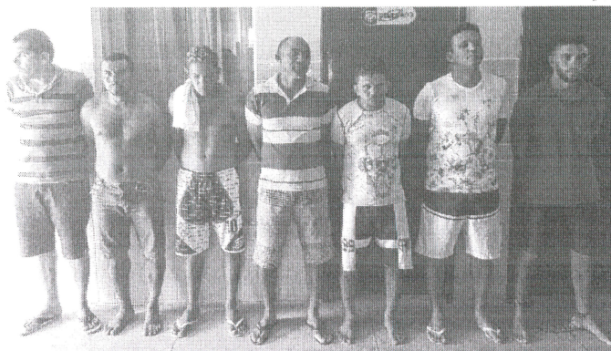
Sete quadrilheiros que foram presos junto com o policial militar do Pará que era o líder do grupo

cas continuam sendo realizadas pelos policiais, com o objetivo de prender os outros quadrilheiros e