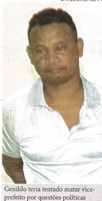
Genildo teria tentado matar vice-prefeito por questões políticas

Na época, o suspeito estava em uma motocicleta e teria dito em voz alta que iria matar tanto o vice-prefeito como o prefeito de Penalva, Ronildo Campos Silva (PP). (NELSON MELO)