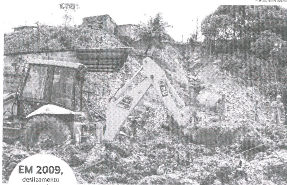
Falta de opção

O Estado também esteve no bairro Copalinho, que registrou a mais recente morte por soterramento na ca-