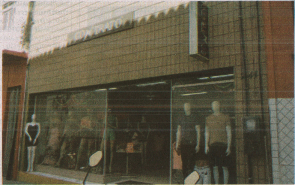
Em um dos arrombamentos, a loja Contrato sofreu um prejuízo estimado em R$ 30 mil