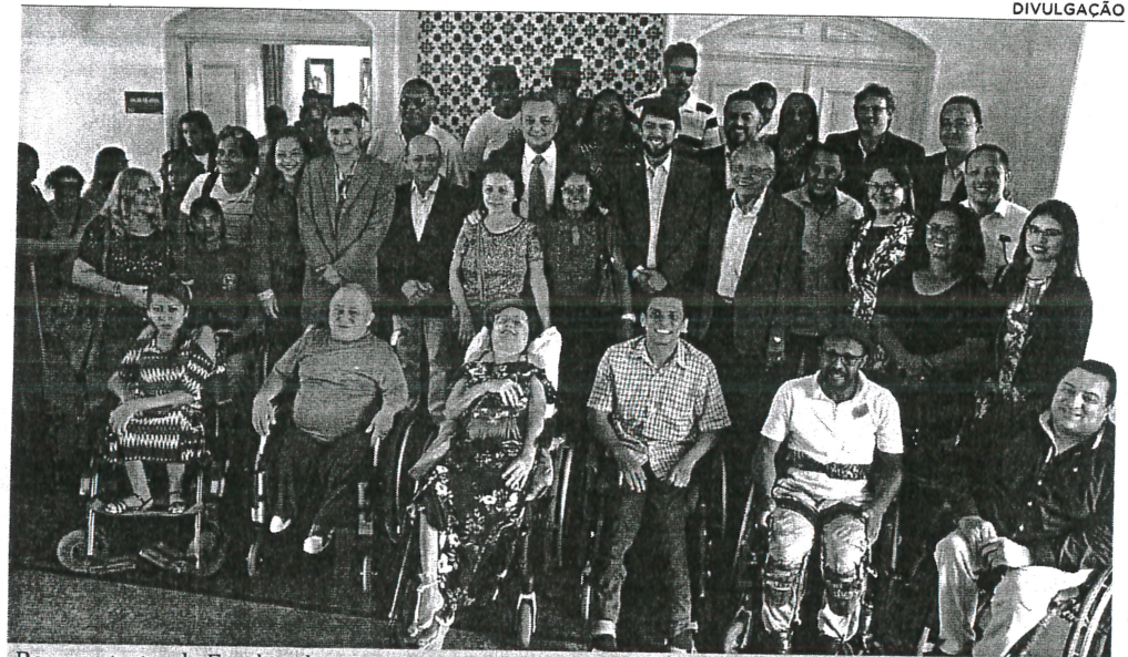
Representantes do Estado e dos movimentos da pessoa com deficiência em momento marcante para acessibilidade na região metropolitana

“Esta é mais uma prova material que o governador Flávio Dino dá para a sociedade e para o Brasil, no tocante à responsabilidade das políticas públicas voltadas para a inclusão social no país”, afirmou o presidente da Agência