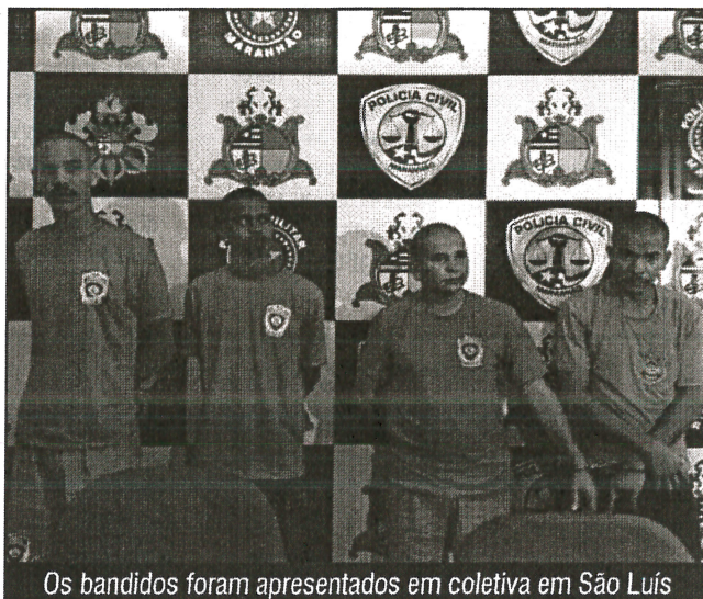
Os bandidos foram apresentados em coletiva em São Luís