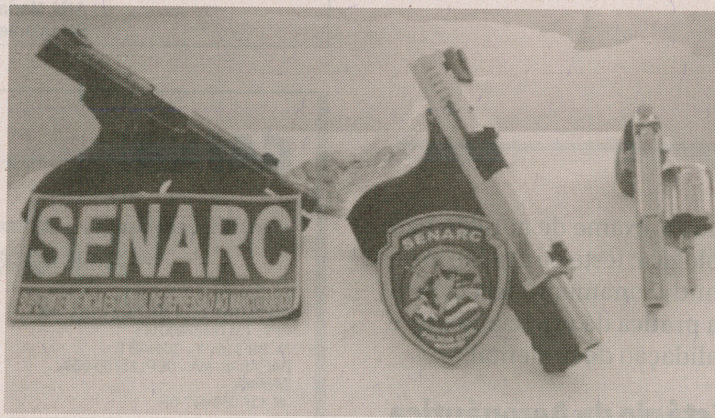
Grupo estava com a posse de arma de fogo de uso restrito

estava com Gago. "A Senarc já vem realizando algumas opera-