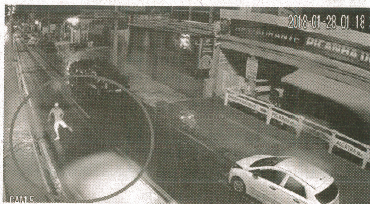
Pedestre foi atropelado na madrugada de domingo

O caso está sendo investigado pela equipe da Delegacia de Acidente de Trânsito (DAT), no Centro.