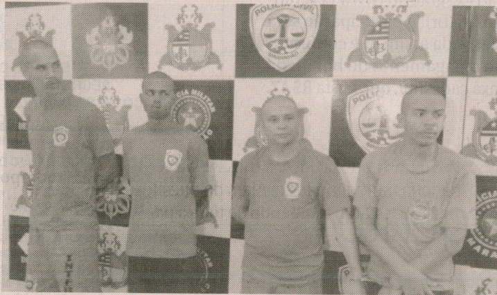
Quarteto é suspeito de praticar roubos e homicídio no estado

Na ocasião, os policiais estavam fazendo barreiras de rotina no posto da PRF, situado no povoado São Francisco, Itapecuru-Mirim, quando realizaram a abordagem no veículo táxi GM Prisma, de placa PSR-9785. Após uma revista, foram encontradas três armas, sendo um revólver calibre 38, que estava no interior do veículo, uma pistola calibre 0.40, que estava com Zarolho e outra pistola calibre 0.40, que