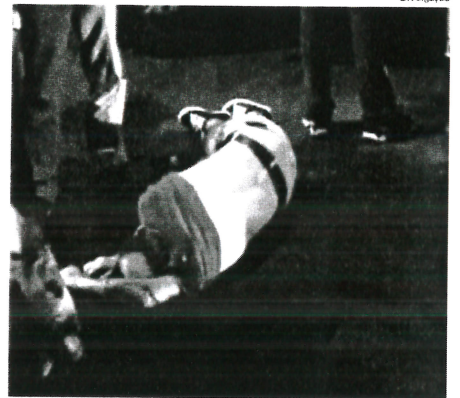
Corpo do turista na pista da Avenida Litorânea após atropelamento