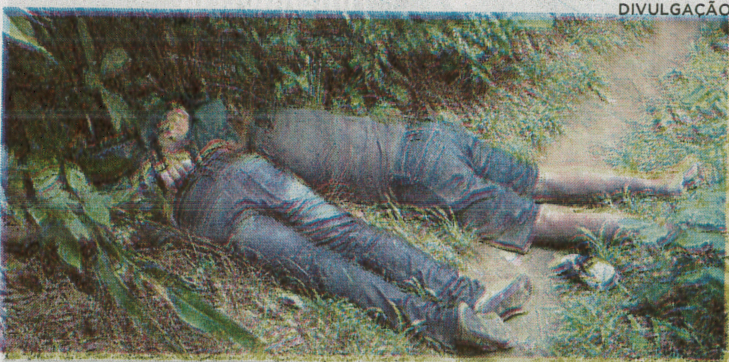
Vítimas de duplo homicídio eram apontadas como autoras de pistolagem e estelionato

Ainda está sob investigação um duplo homicídio ocorrido na zona rural da cidade de São Vicente Férrer, localizada no norte do Maranhão, no domingo (28). Em um trecho preenchido pelo mato,