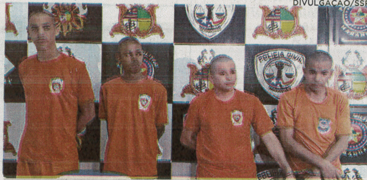
Os quatro presos estavam com pistolas pertencentes às polícias Militar e Civil