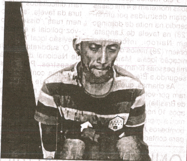
O homem atacou uma passageira do coletivo, a fim de roubá-la, mas foi capturado pelos pedestres, que lhe deram uma surra