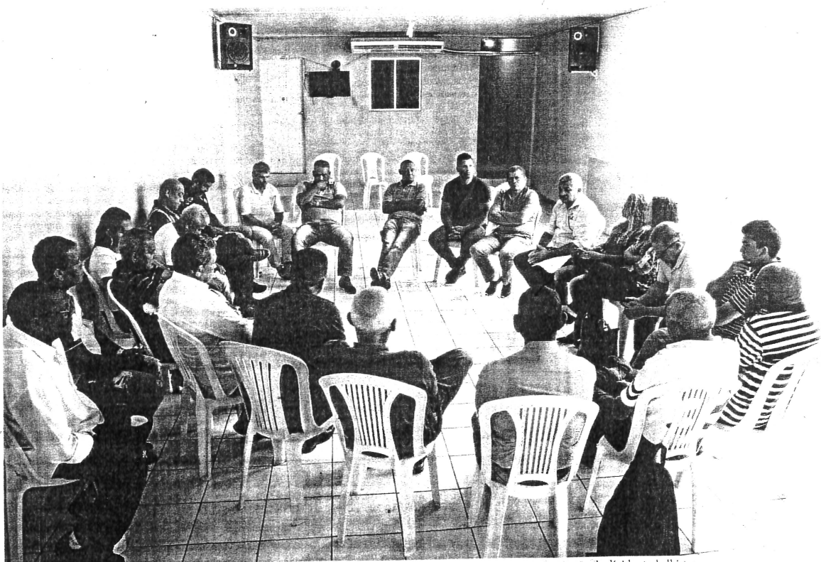
Em reunião, na manhã de ontem, rodoviários decidiram dar um ultimato aos empresários em relação aos atrasos na quitação de dívidas trabalhistas

Segundo o presidente do Strema, caso não haja quitação nos vencimentos até o quinto dia útil de fevereiro, será recomendado que os trabalhadores cruzem os braços. “Notificamos todos os órgãos, como Ministério Público do Trabalho, Prefeitura, e Justiça do Trabalho, e até o momento ninguém chamou a gente para uma possível mediação. É um descaso total. Vamos reiterar os ofícios enviados, informando que, se até o quinto dia útil de