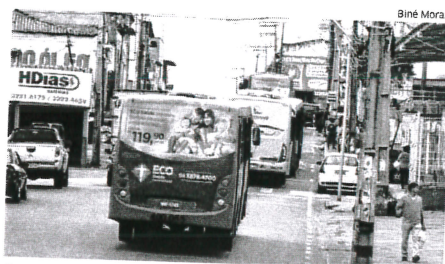
Caso os rodoviários decidam pela greve, ônibus podem parar em SL.

Trabalhadores se queixam dos constantes atrasos de salário e benefícios da categoria