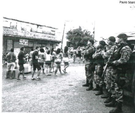
Policiais militares serão instruídos sobre como agir em caso de assédio