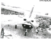
Monomotor que transportava 300 kg de cocaína pura

Ele disse que policiais se deslocaram até a aeronave e dentro do avião encontraram seis sacos contendo 30 tabletes da droga. Nas proximidades da aeronave, havia a outra parte.