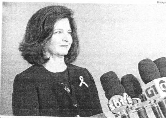
Procuradora-geral da República, Raquel Dodge, diz que todos os dados serão compilados num mesmo espaço

A resolução 115 de 2014 do CNMP já havia determinado a publicação da remuneração dos mem-