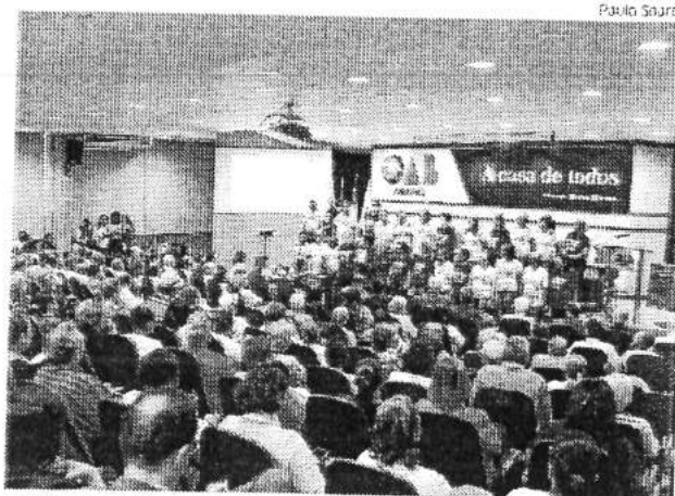
Audiência pública discutiu acessibilidade e mobilidade para idosos

Evento foi realizado pelo MPMA para conscientizar a sociedade sobre as condições de acessibilidade