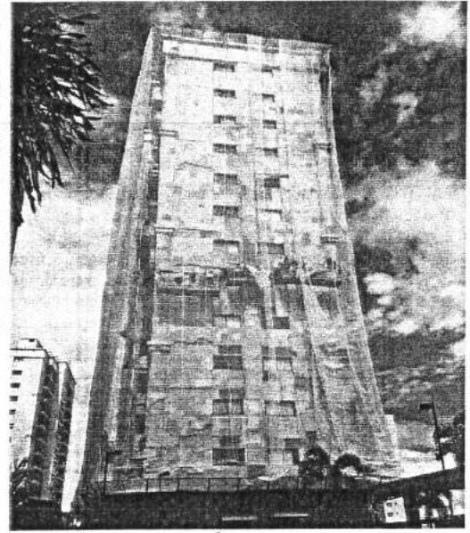
Nova vistoria no Jardim de Toscana constatou, entre outros problemas, que pastilhas estariam sendo colocadas de forma parcial

de agosto do ano passado. Outras vezes, o Corpo de Bombeiros encontrou problemas semelhantes, como irregularidades nas instalações elétricas, na sinalização de segurança entre outros, que também ofereciam risco para os moradores.