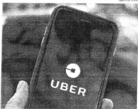
O aplicativo tem sido alvo de manifestações por parte de taxistas

"Eu acho que, com esse texto, você garante uma realidade da qual a sociedade hoje utiliza muito, que são os aplicativos. Somado a isso, você garante que a regulamentação será num ambiente correto, que são os municípios. Não é uma lei federal que pode e deve regulamentar esse