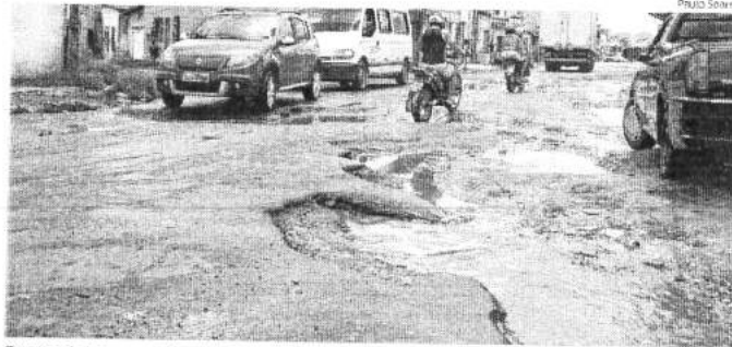
Excesso de buracos na Avenida Tancredo Neves, via que dá acesso ao Socorão II, deixa trânsito difícil

A Secretária Municipal de Obras e Serviços Públicos (Semosp) informou que mantém equipes que trabalham continuamente a manutenção da pavimentação das avenidas da cidade, a fim de garantir a mobilidade nos corredores viários, além da realização das obras de reparamento e asfaltamento em ruas em diversos bairros. Infor-