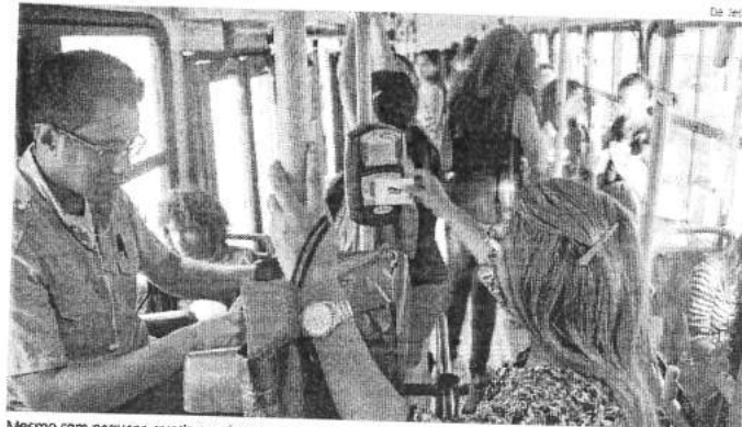
Mesmo com pequena queda no número de assaltos a ônibus de 2016 para 2017, ações criminosas se mantêm