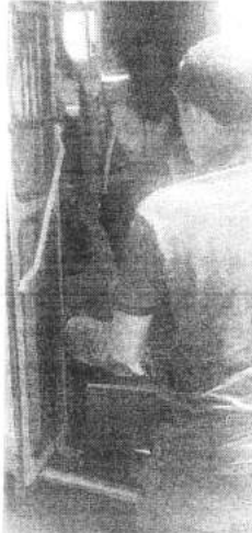
Atendimento em assalto em 2017