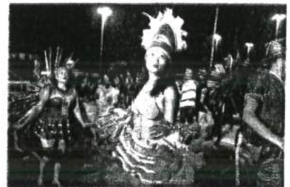
ESCOLAS DE SAMBA FIZERAM UM GRANDE DESFILE