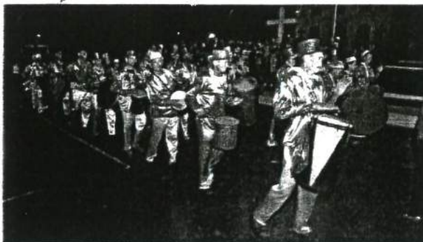
A TRADIÇÃO MANTIDA NA FESTA PARA DELEITE DA POPULAÇÃO

mas mantendo as tradições, que são importantes. Muito me orgulha ter colocado Bequimão entre os principais carnavais da Baixada Maranhense, e até do estado. Esse trabalho não para".