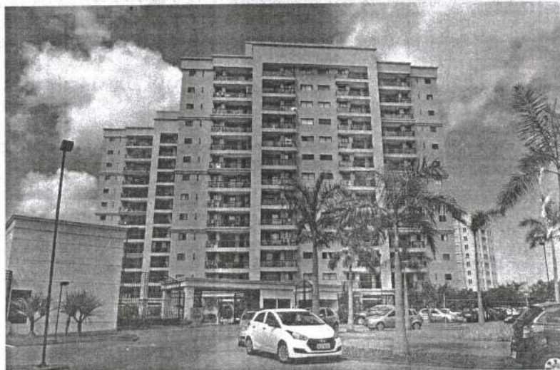
Moradores estão incomodados com novos problemas surgidos no condomínio da Cyrela