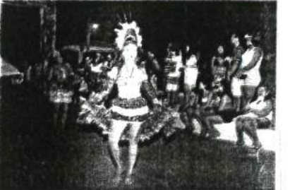
PASSISTAS MOSTRARAM BELEZA NAS APRESENTAÇÕES

mas mantendo as tradições, que são importantes. Muito me orgulha ter colocado Bequimão entre os principais carnavais da Baixada Maranhense, e até do estado. Esse trabalho não para".