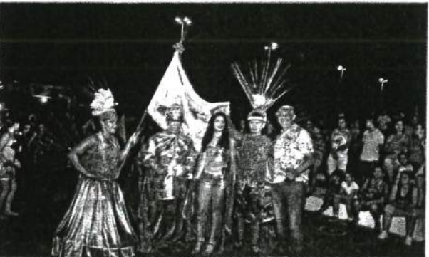
AGREMIações CARNAVALESICAS LOCAIS PROPORCIONARAM UM ESPETÁCULO A PARTE