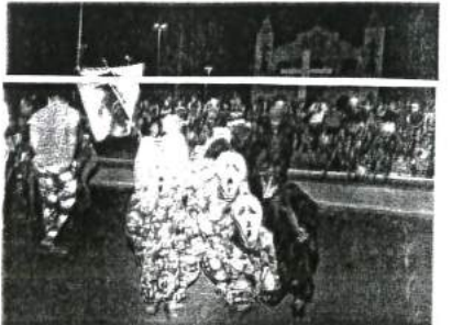
FOLIÕES - PERSONAGENS DA FOLIA NA PRAÇA DA MATRIZ