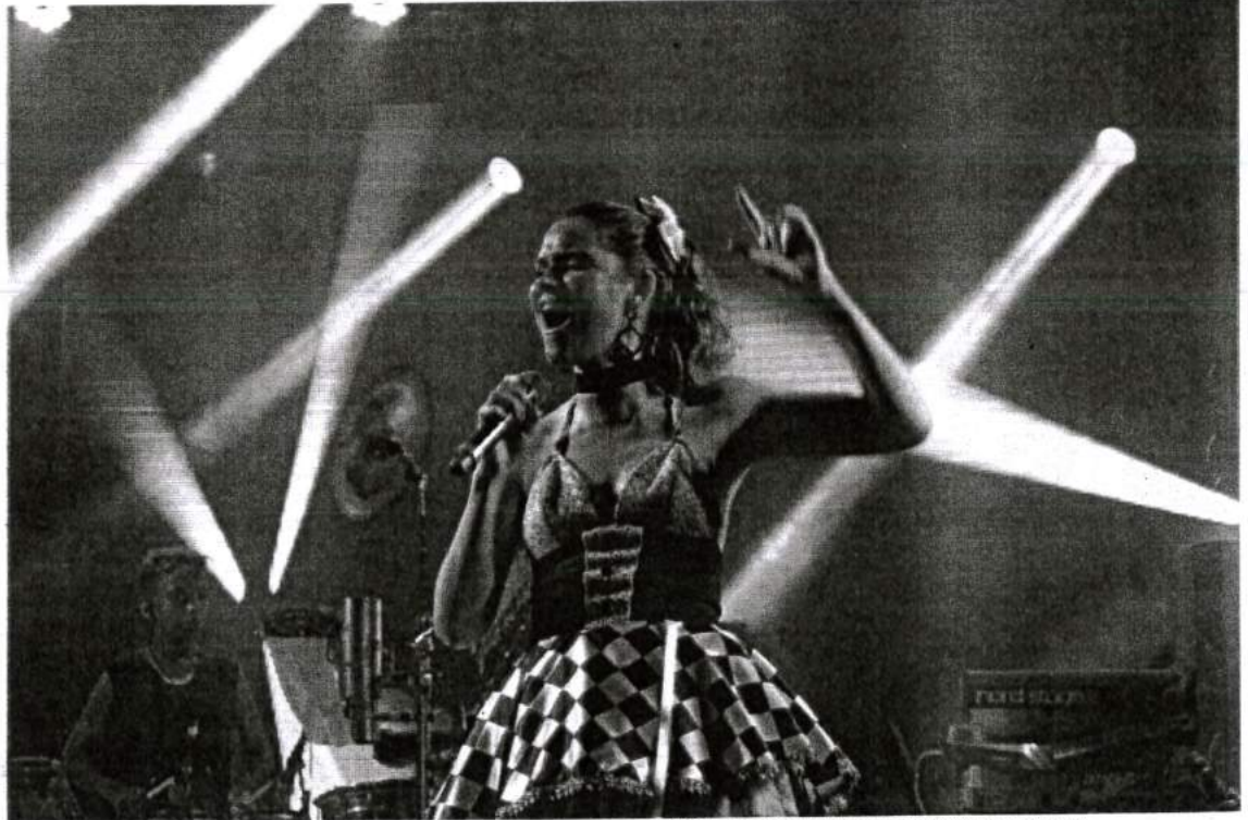
A BANDA LIMÃO COM MEL MARCOU A NOITE DA SEGUNDA-FEIRA DE CARNAVAL COM UM GRANDE SHOW NA PRAÇA 2 DE NOVEMBRO