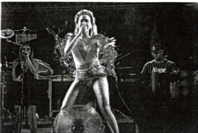
BEQUIMÃO SE CONSOLIDA COMO UMAS DAS MAIS ANIMADAS FESTAS CARNAVALESÇAS DO ESTADO