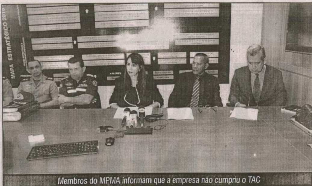
Membros do MPMA informam que a empresa não cumpriu o TAC

“Os mesmos problemas identificados desde o ano passado permanecem. Ou seja, a água é sem qualidade, continuam os riscos com o fornecimento de gás e com as instalações elétricas, sem falar