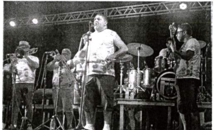
SUCESO NO CARNAVAL DE SÃO LUÍS, A BICICLETA DO SAMBA MARCOU PRESENÇA EM BEQUIMÃO