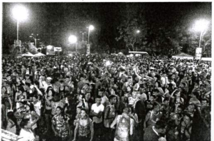
UMA MULTIDÃO LOTOU A PRAÇA 2 DE NOVEMBRO NOS QUATRO DIAS DE CARNAVAL