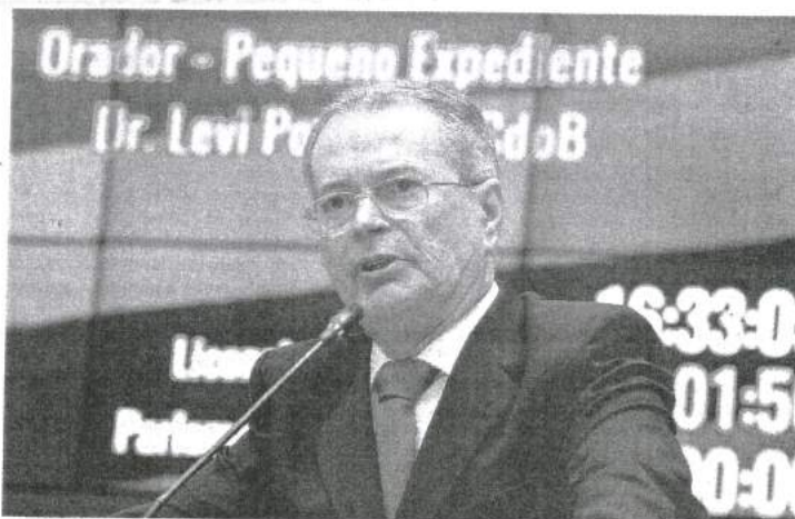
Deputado estadual Levi Pontes (PCdoB) está envolvido em nova polêmica após vazamento de áudio na web