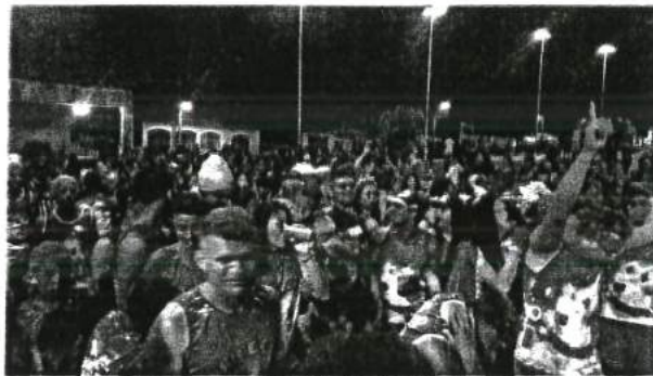
BLOCOS FIZERAM A FESTA NA PRAÇA DA MATRIZ NO CORAÇÃO DA CIDADE