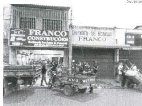
Estabelecimentos em Coroatá flagrados com falsificação de energia

Na madrugada do dia 22 de fevereiro, um cerco policial da Polícia Militar desarticulou uma organização criminosa especializada em contrabando de mercadorias oriunda do Suriname. A base desse bando era um sítio no povoado Arraial, no Quebra-Pote, onde foi presa parte do bando que foi conduzida à sede da Seccor, no bairro São Francisco. Abida no local, foram apreendidos armas, munições, veículos e carga de cigarro e uísque, segundo a polícia, avaliada em torno de R$ 2 milhões. ●