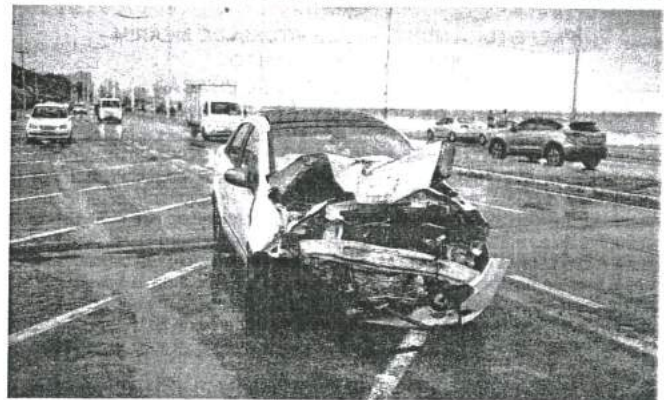
Saveiro acabou no poste depois de colidir com o Siena, na Litorânea