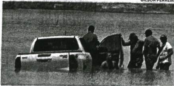
Hilux amanheceu tragada pela maré, na marina da Ponta d'Areia