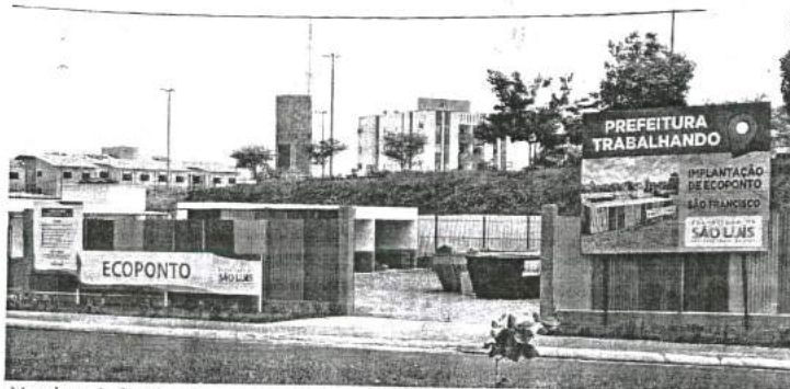
Moradores do São Francisco e bairros vizinhos parecem desconhecer a existência do ecoponto e descartam lixo em qualquer lugar