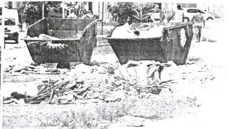
Não é difícil flagrar pontos de acúmulos de resíduos ao longo da Avenida Ferreira Gullar, até bem ao lado dos containers vazios