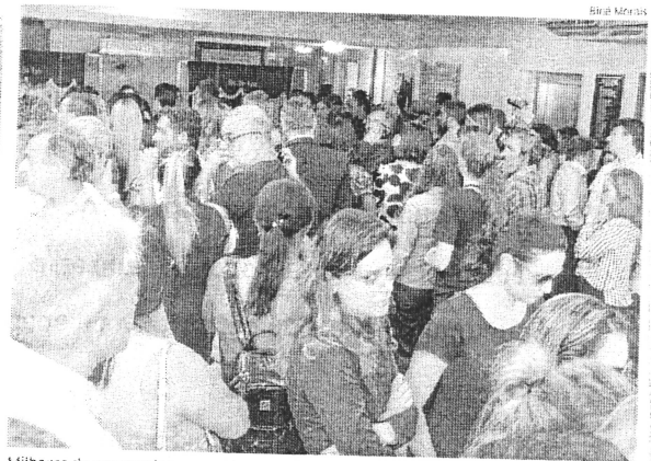
Milhares de pessoas lotaram ontem a sede do CRM para o velório coletivo dos médicos

“Essa testemunha ouvida ontem é de suma importância para tirar as dúvidas sobre a queda dessa aeronave”