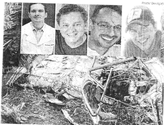
As quatro vítimas e os destroços do helicóptero; caso é investigado pelo Seripa