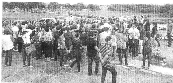
Multidão acompanhou o velório dos três médicos no CRM, na manhã de ontem, e o enterro no final da tarde