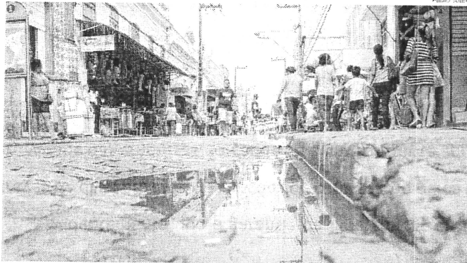
Com muitos problemas estruturais, a Rua Grande começará a passar por requalificação neste mês

De acordo com o Iphan, a obra prevê o embutimento da fiação aérea e lógica, drenagem profunda e esgotamento sanitário e arquitetônico, com novos equipamentos urbanos, piso e acessibilidade. Será feita a recomposição de toda a rede de infraestrutura da Rua Grande, a exemplo de esgotamento sanitário, drenagem de água pluvial, embutimento de toda a rede elétrica e telefônica, bem como outros serviços.