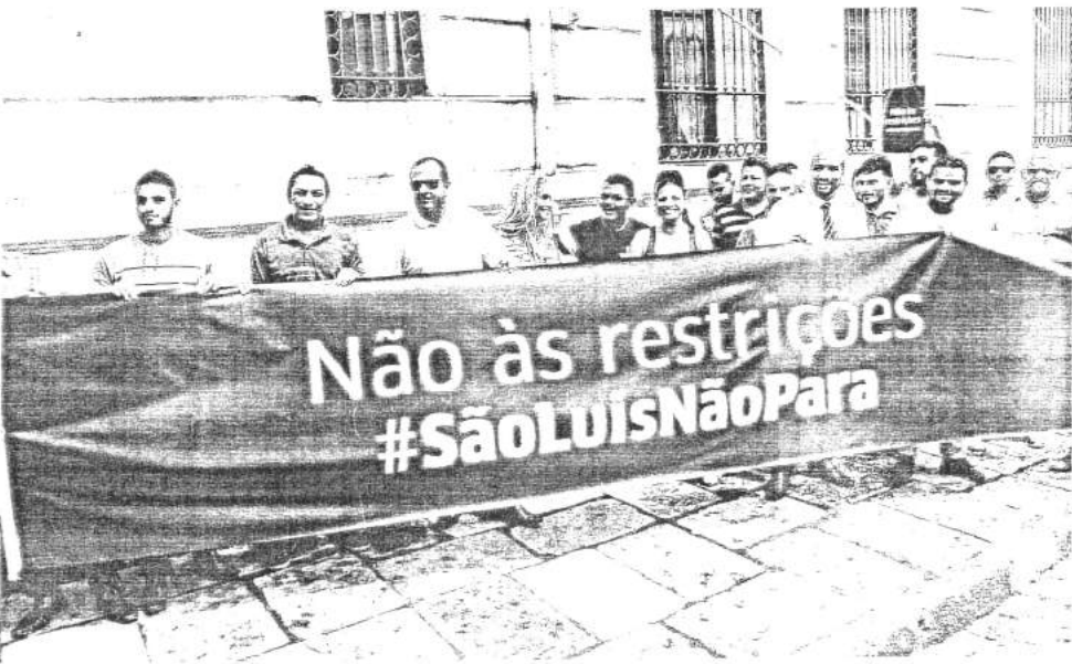
Motoristas de Uber foram à Câmara Municipal acompanhar votação de emendas relacionadas à categoria.