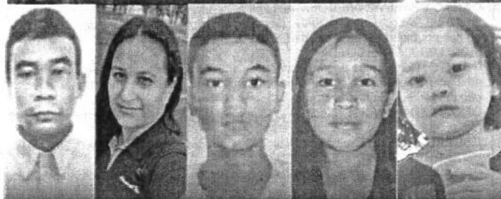
Casal maranhense e os filhos mortos em acidente de trânsito, em SP

na Vila Yolanda Costa e Silva, em Sumaré/SP. De lá, os corpos foram enviados a Campinas, de onde foram transportados em um avião, do Aeroporto de Viracopos, até o Maranhão, para serem sepultados, no Cemitério Municipal de