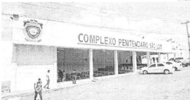
Complexo de Pedrinhas, que na terça-feira recebeu 630 apenados dos 672 que saíram para a Páscoa

Os artigos 122 e 123 da Lei de Execução Penal (LEP) estabelecem cinco saídas temporárias às quais os presos que cumprem pena em regime semiaberto têm direito durante o ano (Páscoa, Dia das Mães, Dia dos Pais, Dia das Crianças e Natal). A autorização é concedida por ato motivado do juiz da Execução, após ouvir o Ministério Público e a