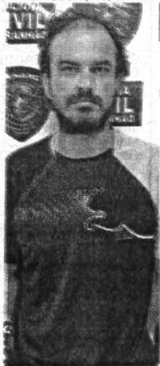
"Maurinho" possuía um mandado de prisão e foi flagrado com cocaína