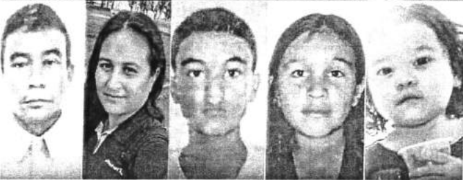
Cinco das seis vítimas de um acidente na rodovia João Mellão, em Pratânia, no interior paulista