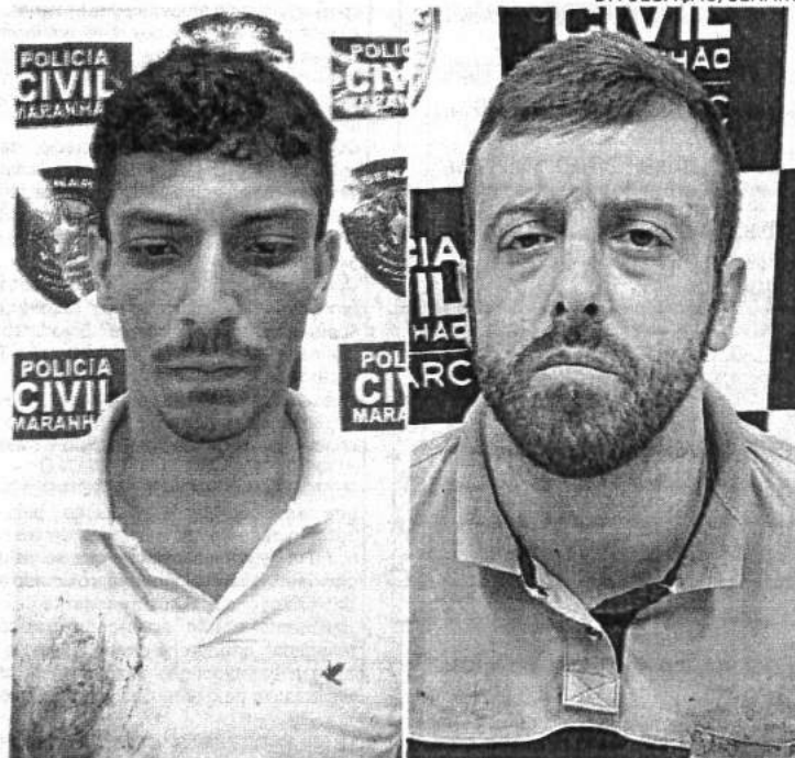
Dupla capturada após denúncias de venda de drogas em residência