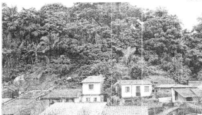
Residências localizadas em área de risco de deslizamento na Vila Dom Luís, na área Itaqui-Bacanga

"O nosso trabalho nessas regiões é constante. Voltamos às casas mesmo que já tenhamos passado outrora para o convencimento, com psicólogos e demais parceiros, para ajudá-los a sair dos locais. Só que as pessoas precisam entender apenas que precisarão