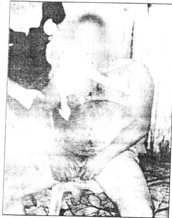
Homem disse que estava sendo roubado por ela