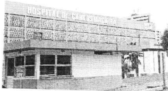
Denúncias apontam problemas no Hospital Dr. Carlos Macieira