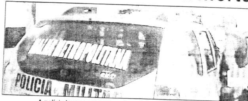
A polícia levou o suspeito ao hospital, mas ele não resistiu

Durante a fuga, a moto acabou derrapando em razão da pista molhada. O piloto conseguiu se levantar rapidamente e seguiu deixando o comparsa para trás. Os passageiros de um ônibus, que vinha logo em