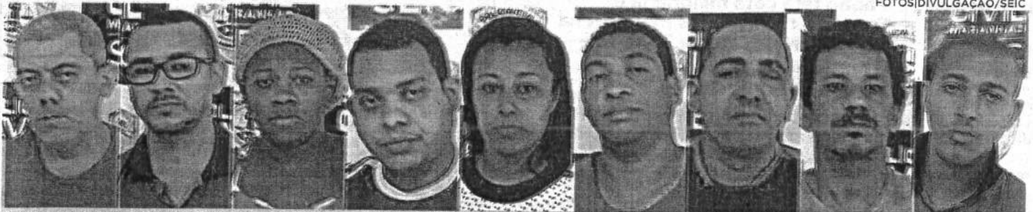
Suspeitos presos durante a Operação Tabuleiro por terem envolvimento com o tráfico de drogas