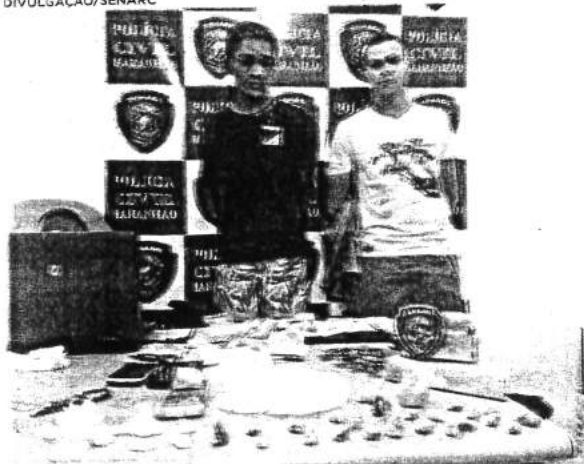
Dupla foi flagrada comercializando drogas em residência, em Timon