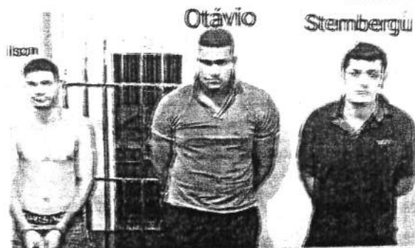
Trio preso em Imperatriz após assaltar barbearia, dois dias seguidos