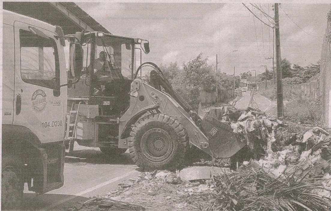
A quantidade de resíduos sólidos recolhidas em São Luís chega a número recorde em 2018

A Prefeitura de São Luís, por meio do Comitê Gestor de Limpeza Urbana, seguindo orientação do prefeito Edivaldo, faz ações de remoções em pontos