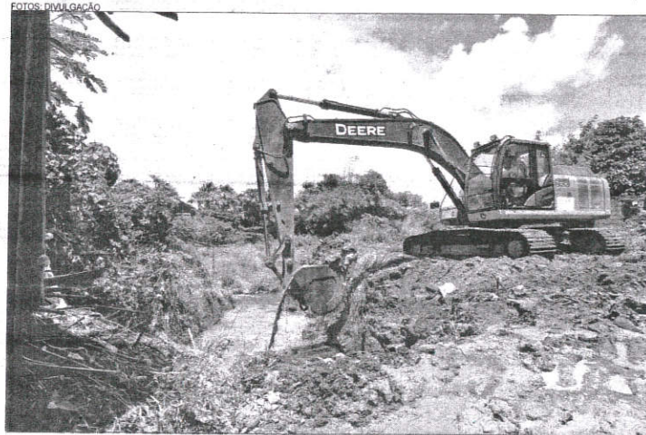
Desobstrução do canal do Rio Calhau é de suma importância para redução de impactos das chuvas