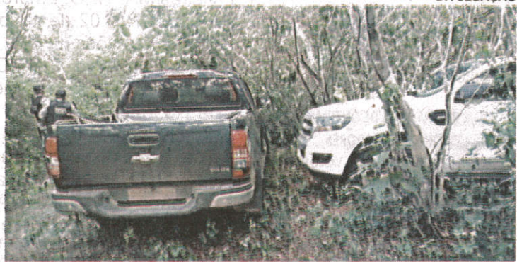
Carros foram encontrados em matagal, no Piauí, e podem ter sido usados em crimes no Maranhão

policiais recolheram objetos como "miguelitos" (objetos pontiagudos utilizados para furar pneus), botijão de gás, maçarico, malotes de dinheiro vazios, radiocomunicadores e outros artefatos que assaltantes de bancos usam para detonar caixas eletrônicos e também para explodir carro-forte. O capitão