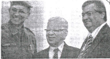
Flávio Dino foi acionado a dar explicações sobre cargos de capelão na PM