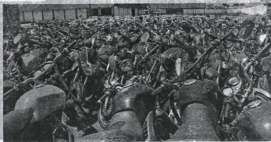
Carros e motos foram apreendidos no Maranhão inteiro por atraso no IPVA, o que era ilegal desde 2015

Pelo decreto, o governo comunista acabou com o procedimento de remoção imediata dos veículos