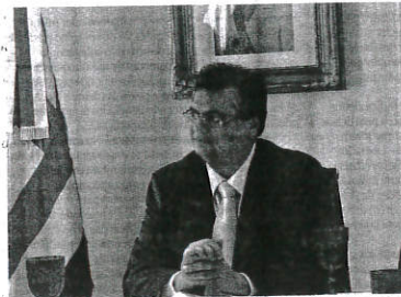
Instado a comprovar pagamento de passagem, Dino criticou imprensa

Governador foi à capital paranaense tentar visitar o ex-presidente Lula e garante que sua passagem de avião foi paga com recursos próprios