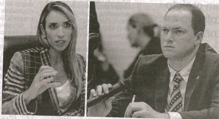
Parlamentares acrescentaram informações sobre a "farra de capelães"

No pedido de intervenção original, datado de 4 de maio, Andrea relatava que "a Polícia Militar do Maranhão está servindo ao PCdoB para promover 'espionagem' e levantamento de dados dos líderes de oposição ao governador Flávio Dino (PCdoB), nas eleições de 2018". A parlamentar apresentou documentos que, conforme ela, são da pró-