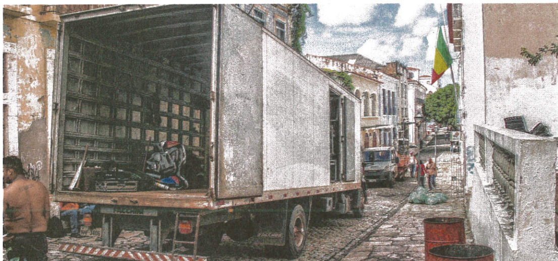
Caminhão recolhe material usado em festa de reggae no Centro Histórico; veículos são comuns na área