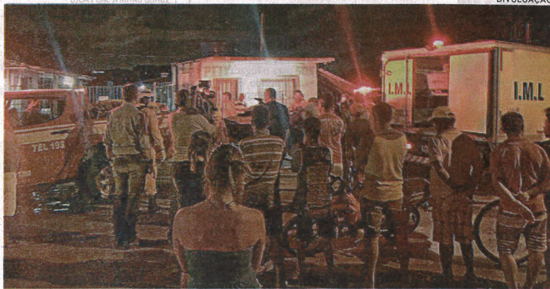
Movimentação foi intensa, na noite de sexta-feira, durante as buscas e regate aos desaparecidos durante o naufrágio

Equipes do Corpo de Bombeiros Militar do Maranhão (CBMMA) e do Centro Tático Aéreo (CTA) continuam fazendo mergulhos e sobrevoos na tentativa de localizar dois pescadores que desapareceram em um naufrágio ocorrido na noite de sexta-feira (11). O caso foi registrado na praia do Mangue Seco, no município de Raposa. Uma terceira vítima foi encontrada morta. Segundo informações divulgadas pelo Corpo de Bombeiros, seis homens, sendo quatro adolescentes, saíram para uma pescaria na praia do Mangue Seco, mas, quando a maré estava baixando, ficaram à deriva, e foram "sugados", ao que o barco teria virado no impacto com as