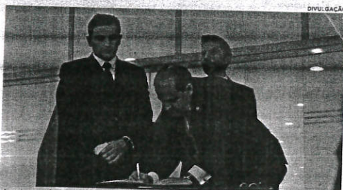
A assinatura da Recomendação ocorreu durante a Jornada de Enfrentamento à Violência Sexual Contra Crianças e Adolescentes

Representantes do Ministério Público do Trabalho do Maranhão (MPT-MA), Procuradoria Regional Eleitoral e Procuradoria Geral de Justiça assinaram nessa sexta-feira (18) uma Notificação Recomendatória Conjunta para que partidos políticos e candidatos não explorem o trabalho de crianças e adolescentes em campanhas político-partidárias. A assinatura ocorreu dentro da programação da Jornada de Enfrentamento à Violência Sexual Contra Crianças e Adolescentes, evento organizado pelo Ministério Público do Estado do Maranhão para marcar o Dia Nacional de Combate ao