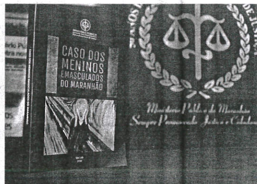
O livro lançado ontem (18), durante jornada realizada pelo MPE, contém documentos, impressões de agentes públicos que participaram da apuração e exames periciais

A "Jornada de enfrentamento à violência sexual contra crianças e adolescentes" ocorreu durante toda a manhã, sendo que começou com a Assinatura de Notificação Recomendatória Conjunta, envolvendo a PGJ, a Procuradoria Regional Eleitoral