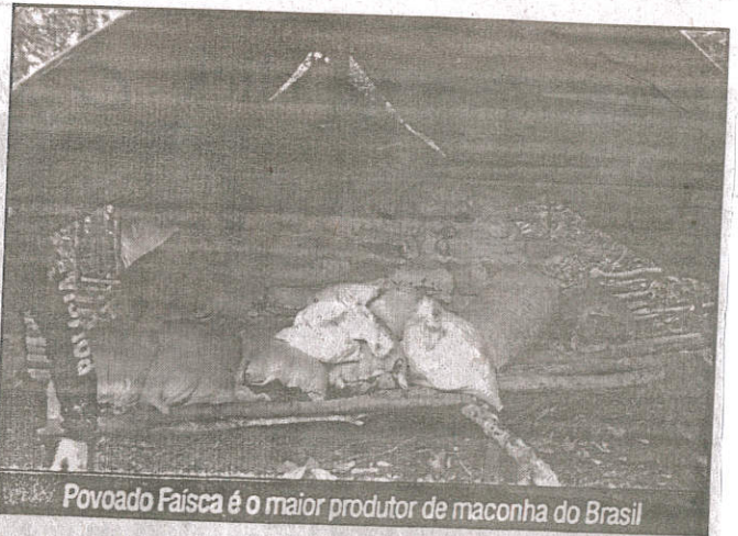
Povoado Faísca é o maior produtor de maconha do Brasil

A polícia informou ainda que outras fases da operação poderão ser deflagradas nos próximos dias. A Polícia Civil não informou para onde o produto foi levado.