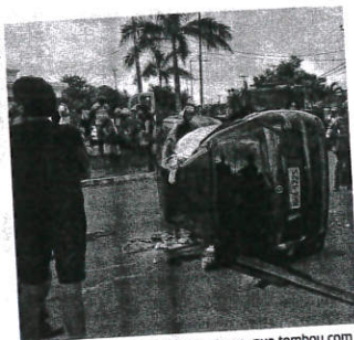
Motociclista atingiu a lateral do carro, que tombou com e