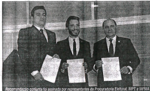
Recomendação conjunta foi assinada por representantes da Procuradoria Eleitoral, MPT e MPMA