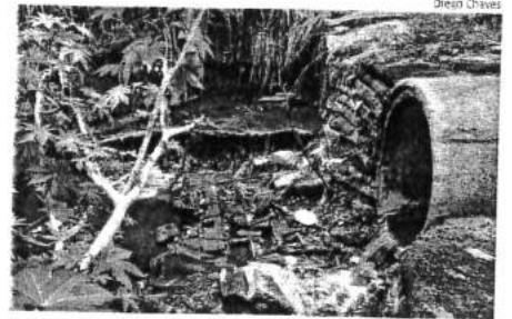
Esgoto exposto e depositado em córrego, que vai para o mar

Córrego fica a aproximadamente 200 metros da Estação de Tratamento da Caema, e esgoto despejado in natura provém de condomínio de classe média-alta, de acordo com moradores.