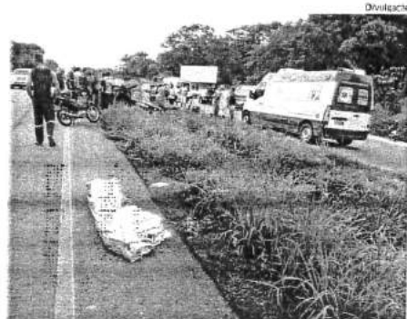
Corpos das vítimas, que ficaram presos, foram retirados por bombeiros