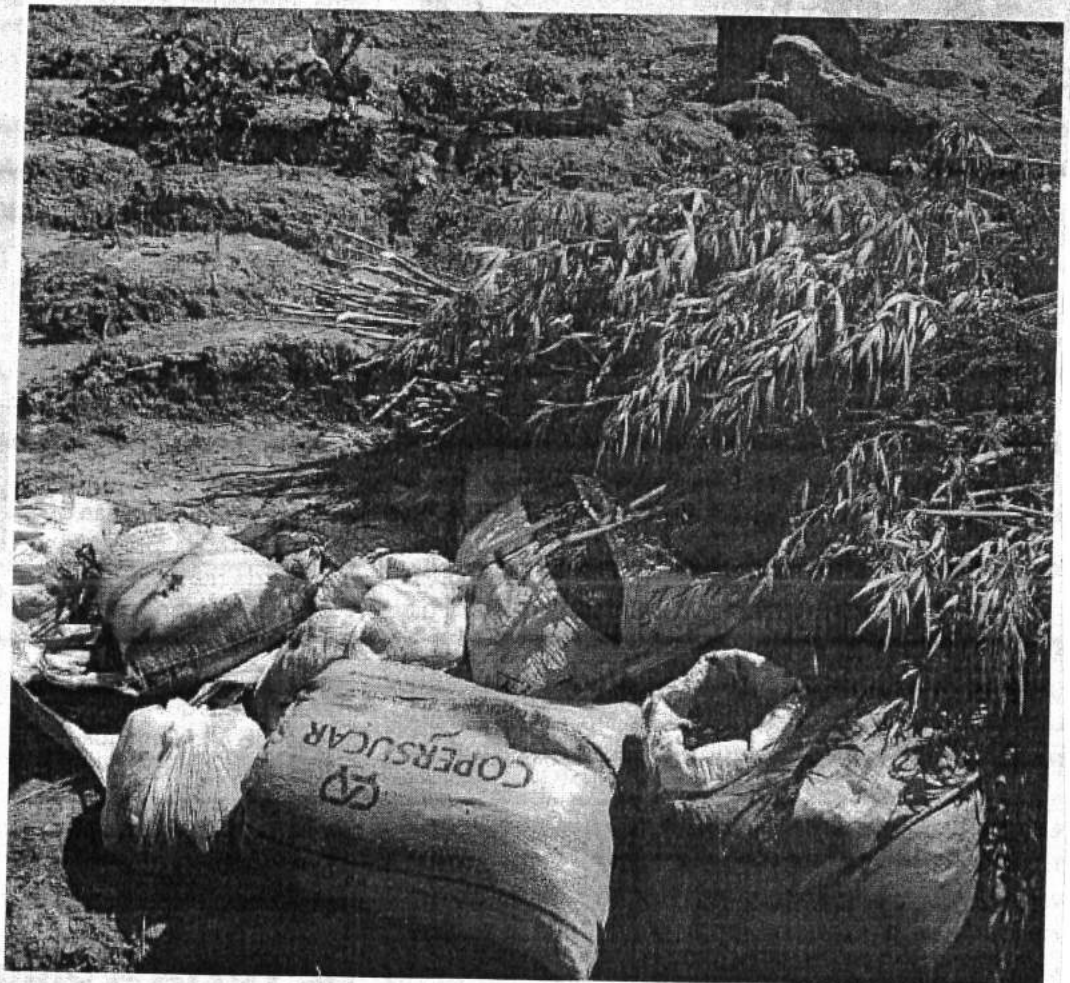
Toda droga foi erradicada e incinerada no local, ninguém foi preso

Sem contar que inúmeras famílias deixaram de ter