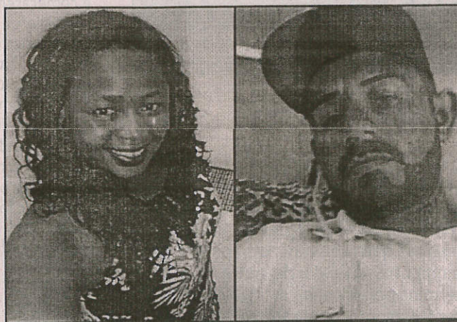
O feminicídio foi registrado em um bar na cidade de Codó