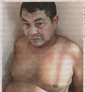
Traficante preso em Apicum-Açu

Foi capturado, na manhã dessa segunda-feira (11), logo nas primeiras horas, um homem, cujo nome não foi divulgado, pelo crime de tráfico de drogas, na cidade de Apicum-Açu, localizada no norte do Maranhão. De acordo com informações do 25º Batalhão de Polícia Militar (BPM), ele foi flagrado cortando e embalando entorpecentes dentro de sua casa. O comando do 25º BPM disse que o suspeito foi preso após o batalhão militar ser informado sobre uma grande quantidade de drogas na residência do autor, que foi observado da janela pela equipe policial. No imóvel, os militares apreenderam uma barra prensada de substância parecida com maconha; 51 "buchas" do mesmo material; uma pedra grande de entorpecente semelhante ao crack e cinco pedras já embaladas da mesma droga. Conforme os militares, também foram recolhidos dinheiro, balança de precisão, tesoura, facas, tubo de linha e papel-filme. Diante do flagrante, o homem foi apresentado na Delegacia de Cururupu. (NM)