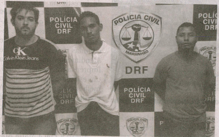
Os suspeitos estavam atacando moradores desde cedo de manhã

Os três suspeitos ainda tentaram fugir em um veículo Fiat Pálio com placas clonadas, mas foram perseguidos e abordados pelos policiais. Os suspeitos foram autuados pelos crimes de associação criminosa armada, porte ilegal de arma de fogo e adulteração de sinal identificador de veículo automotor (clonagem das placas). O trio foi encaminhado para o Complexo Penitenciário de Pedrinhas. (DC)