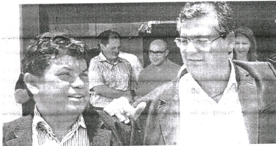
Márcio Jerry é citado em representação de suposta lavagem de dinheiro na campanha de Flávio Dino

Ao admitir a dívida, o PCdoB deveria apontar, então, o destino da