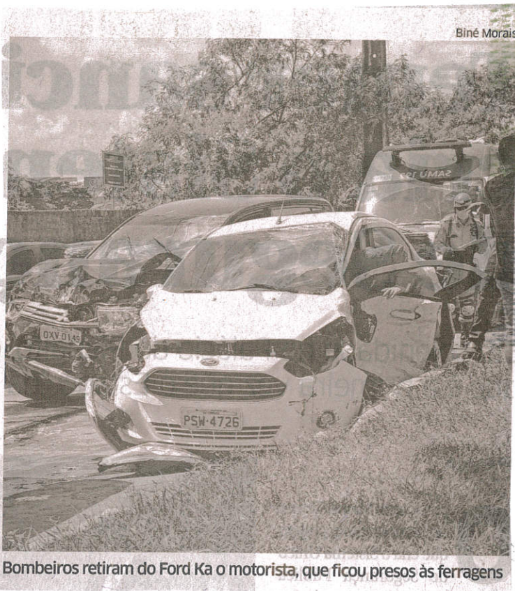
Bombeiros retiram do Ford Ka o motorista, que ficou presos às ferragens