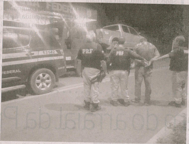
Federais prenderam o ladrão de carros em um bar comemorando

Os assaltantes estavam em uma bar, comemorando, quando foram surpreendidos pela PRF e um deles foi preso. Os federais recuperaram também o segundo veículo, bem como todos os pertences das vítimas. (DC)